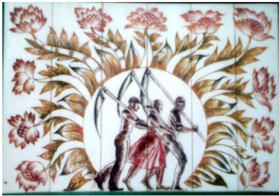
Рис. 4. Н.Д. Буторин. Шкатулка «Сельское утро»