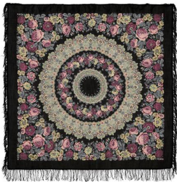
Рис.6. К. Аболихин. Шаль «Молитва»

Благодаря продуманному орнаменту, эти сцены из жизни, изображённые на шкатулках, обретают иной смысл. Фантастические растительные формы не что иное, как обращение к традиционной символике райского сада, древа жизни. Для непосвящённого зрителя этот фон раскрывает своё содержание, благодаря экспрессии и богатству линий, создавая настроение радости и полноты бытия. Художник умело сочетает здесь удивительно реалистические изображения людей и животных с обобщёнными фантастическими изображениями мира растительности. Орнамент, без которого народное искусство немыслимо, в произведении народных промыслов имеет особенное значение в наполнении художественного образа. Удачно подобранный, он иногда достигает невероятной силы звучания. Например, в росписи шали «Молитва» орнаментальная композиция выстроена таким образом, что визуально напоминает собой известную икону «О Тебе радуется» (рис. 6).