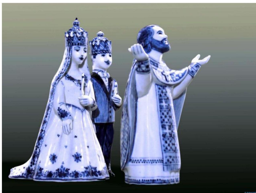
Рис.1. В.С. Бидак. «Венчание»

Художник Гжели В.С. Бидак «духовный мир с его ценностями воспринимает через пластику человека, наблюдаемого в разных действиях в храме» [14, с. 208]. Сохраняя верность традиции, он нашел нужную художественную форму, особую линию для передачи духовных состояний. В скульптурных группах, выполненных им, угадывается близость образов к иконным, за счёт чего и зрителю, воспринимающему художественное произведение, передаётся особое состояние торжественности происходящего, тихого величия, самой атмосферы предстояния перед Высшим (рис. 1).