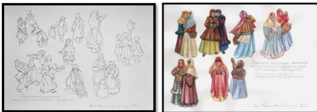
Рис. 4, 5. Этап «Сбор наглядных и теоретических материалов» (выполнение графических зарисовок)

Первый и второй этапы «Выбор художественной идеи» и «Сбор наглядных и теоретических материалов» тесно связаны между собой, т.к. найденный материал может повлиять на корректировку первоначальной идеи. В поиске материала для будущего изделия лаковой миниатюрной живописи используются: наблюдение за живой природой, фотографии природных объектов, сюжеты мифов и сказок, материалы печатных изданий по федоскинской лаковой миниатюре, изучение живописных и графических (иллюстраций) работ художников в музеях и в книгах (рис. 4, 5).