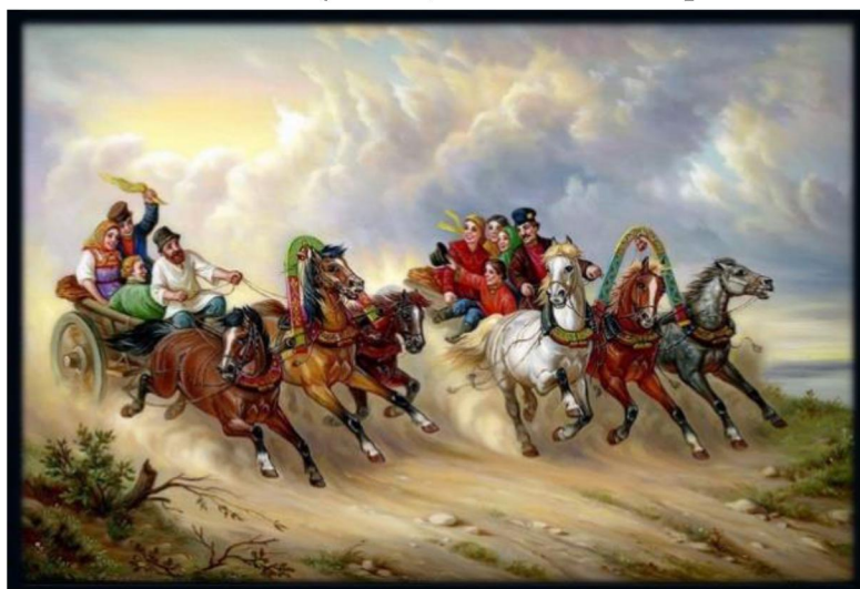
Рис. 1. Городилин В.Б. «Обгоню», панно, 2011. Смешанная техника письма («по-плотному» и «по-сквозному»). Материалы: папье-маше, масляные краски, лак, сусальное золото

Базовые основы композиции едины для всех видов искусств, но в каждом конкретном виде искусства существуют особенности. В частности, в основе композиции федоскинской лаковой миниатюрной живописи заложены три принципа организации живописного пространства – круг, движение, центр. На основе этих принципов в процессе проектирования строится композиционное пространство будущих изделий федоскинской лаковой миниатюрной живописи. Принцип движения составляет основу одного из наиболее динамичных сюжетов – «Тройка», в котором заложена идея молодецкой удали, нашедшая выражение в постоянном и стремительном