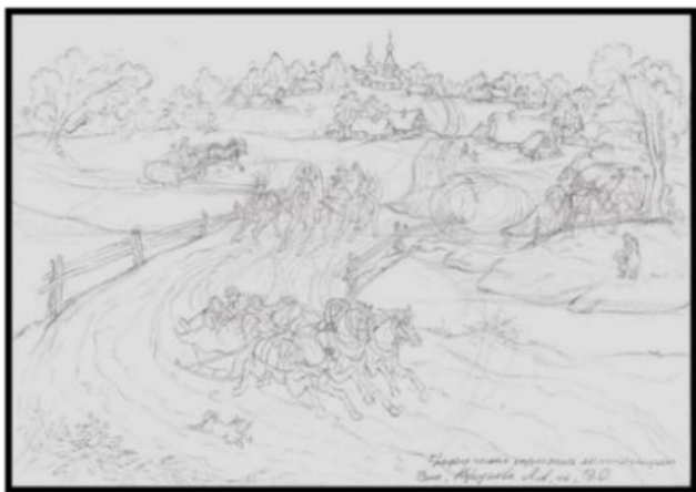
Рис. 11. Графические эскизы проекта