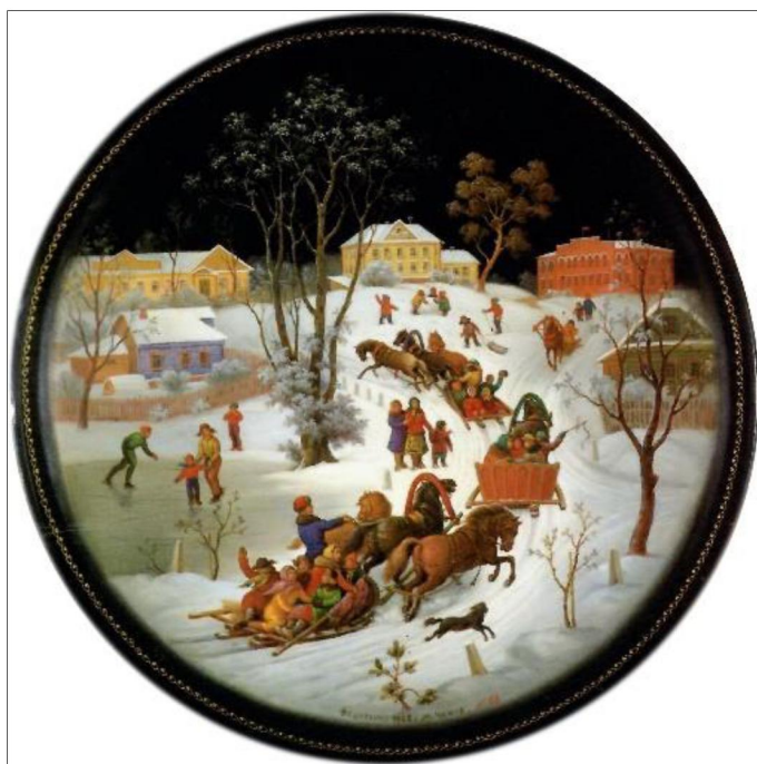
Рис. 14. М.С. Чижов «Праздник зимы в Федоскине», 1968

Композиция состоит из трех планов. Центром композиции является мчащаяся тройка лошадей, запряженная в сани. Справа и слева от нее расположены люди, которые уравнивают композицию.