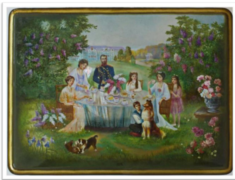
Рис. 2. Баранова А. «Царская семья», ларец, 2019. Выпускная квалификационная работа. Руководитель М.А. Салтанов. Смешанная техника письма («по-плотному» и «по-сквозному»). Материалы: папье-маше, масляные краски, лак, сусальное золото, перламутр. 27x20x10

Примером композиции с выделенным центром является сюжет «Чаепитие», где центр представлен ярким цветным пятном, несущим основную смысловую нагрузку (рис. 2). Принцип круга реализуется при воплощении идеи кругового движения, динамики и наиболее полно проявляется в сюжете «Хоровод» (рис. 3). Круг как бы обрамляет, определяет и выделяет собой центр, и, одновременно с этим,