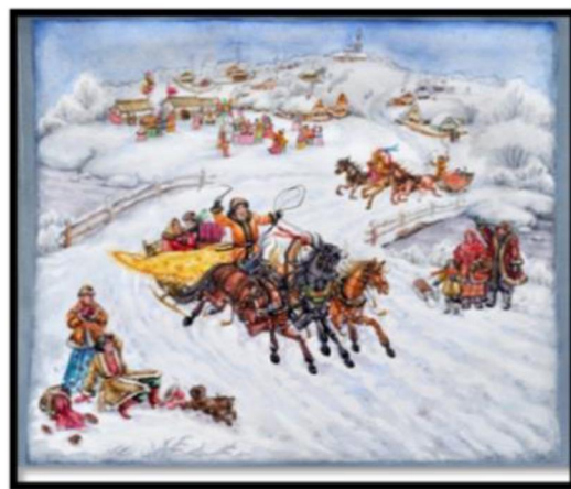
Рис. 12. Цветовые эскизы проекта

Разработанный проект служит основанием для выполнения изделия федоскинской лаковой миниатюрной живописи в материале (рис. 13).