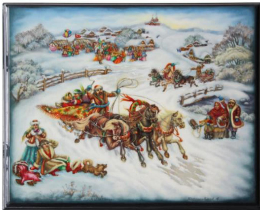
Рис. 13. Л. Корсукова «Праздник русской зимы», панно, 2020.

Разработанный проект служит основанием для выполнения изделия федоскинской лаковой миниатюрной живописи в материале (рис. 13).