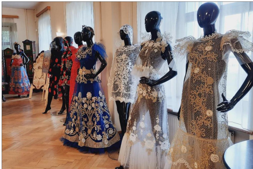
Рис. 2. Выпускные квалификационные работы студентов кафедры художественного кружевоплетения Высшей школы народных искусств (академии)

Активный поиск решений и желание найти наиболее выигрышный вариант способствуют инновационным находкам, ряд из которых апробируется и закрепляется в практике художественного кружевоплетения. Создавать новое всегда интересно и рискованно, но результат всегда оправдан: либо в итоге видишь гениальное произведение или убеждаешь себя, что больше этого решения никогда в практике не используешь.