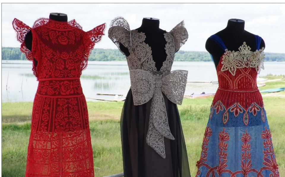
Рис. 1. Выпускные квалификационные работы студентов кафедры художественного кружевоплетения Высшей школы народных искусств (академии)

В структуре подготовки будущего художника традиционных художественных промыслов, специализирующегося в области художественного кружевоплетения, необходимы профессиональные знания технологического исполнения различного вида кружева: парного, многопарного, сцепного и парно-сцепного. Студенты владеют разными видами построения орнамента, создают классические и инновационные варианты кружевных изделий, моделируют и конструируют масштабные изделия, объемные элементы одежды. На высоком профессиональном уровне выполняют сколок кружевного изделия, создают кружево по сколку, применяют в работе различные технологические приёмы и виды кружевоплетения, варьируют фактуру и цвет кружева (рис. 1-2).