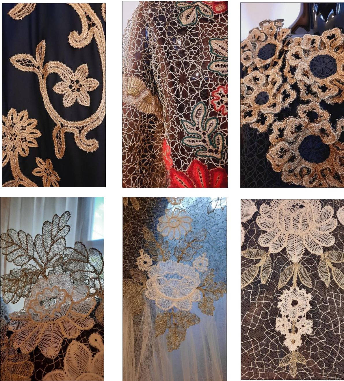
Рис. 5-10. Фрагменты выпускных квалификационных работ студентов кафедры художественного кружевоплетения с новаторскими решениями

За семнадцатилетний период работы Высшей школы народных искусств (академии) кружево кафедры художественного кружевоплетения приобрело узнаваемые черты, которые невозможно перепутать ни с одним региональным видом: в изделиях все продумано до мелочей, композиция наполнена смыслом, построение художественного орнамента доведено до академизма, технология отточена до совершенства. Классика остается в художественном содержании произведения и в технологическом исполнении, но