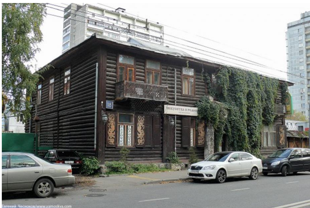
Рис. 2. Особняк Н. Малютина. 2016 г.