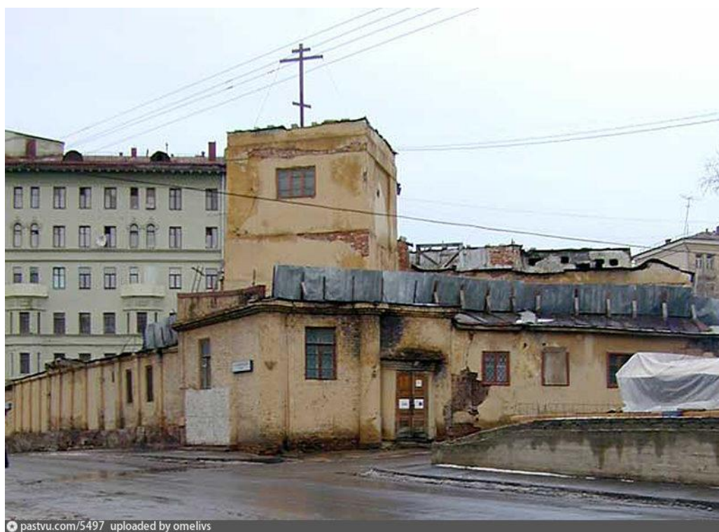
Рис. 3. Мастерские п/о «Художественная Гравюра» в храме Николая Чудотворца в советское время