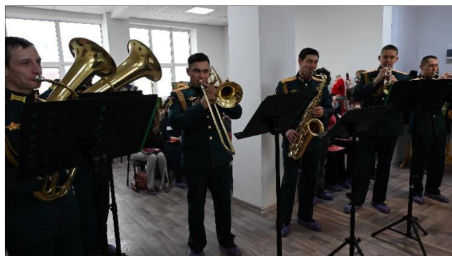
Рис. 2. Выступление духового оркестра Войсковой части 14258