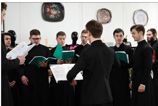
Рис. 1. Выступление студентов Московской духовной академии