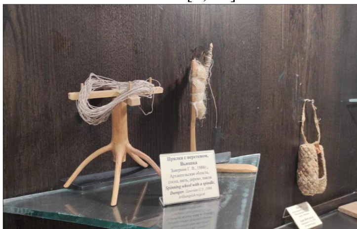
Рис. 3. Прялка с веретеном, вьюшка. Архангельская обл. ХПМИ им. Н.Д. Бартрама

качества как забота, внимание, сострадание; формируются чувства ответственности и любви [8; 17].