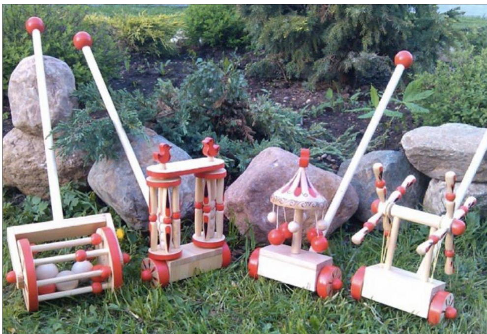
Рис. 10. Дипломный проект народных игрушек-каталок, выполненный студентом Сергиево-Посадского института игрушки

В игре формируется воображение ребенка. Во время игры мысли, действия и эмоции ребенка взаимосвязаны и работают одновременно. Игра помогает социализации, расширяя роли, в которых ребенок может себя позиционировать. Это является причиной особого внимания к характеру игр и игрушек, которые сегодня зачастую не отвечают запросам гуманности, доброты и духовности. И если среди игрушек для мальчиков и раньше были бравые солдатики или гусары, которым хотелось подражать и соответствовать, защищая свою Родину, то, к несчастью, многие современные игрушки своим внешним видом и образом антигероя навязывают детям тягу к агрессии. Например, роботы-трансформеры, провоцирующие насилие и разрушения в игре.