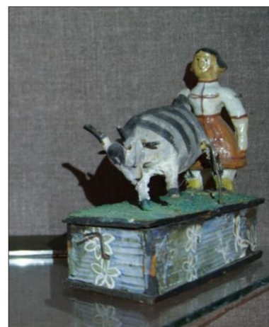
Рис. 4. Девочка с козой. Сергиевский Посад, середина XIX в. ХПМИ им. Н.Д. Бартрама

Наиболее популярной в районах России была деревянная игрушка, изготовленная из липы, березы, которая неразрывно связана с культурными, бытовыми, фольклорными особенностями. Сергиев Посад и деревня Богородское считаются наиболее известными центрами создания традиционных деревянных игрушек, в которых воплощались сюжетные композиции: трудолюбивый мужик и его могучий конь, мужик и косолапый медведь, рубящий дрова и др. Ребёнок, взаимодействуя с подобными игрушками, проигрывал зачастую все ситуации из жизни – свадьбу, рыболовство, охоту, так он изучал традиции и моральные устои. Получая опыт в игре, дети овладевали порядком ведения праздника, изучали мелодию, текст и манеру пения, осваивали правила, необходимые в различных ритуалах – в этом и состоит педагогическая роль народной игрушки – дети в игре учатся, для них в этом возрасте важно освоение социальных ролей в первом приближении.