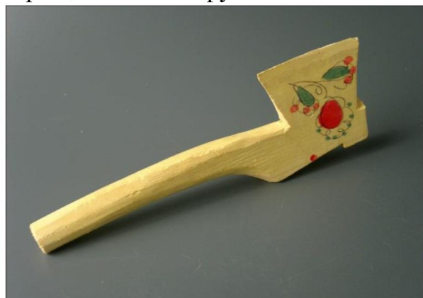
Рис. 2. Топор. Горьковская (Нижегородская обл.), сер XX в. ХПМИ им. Н.Д. Бартрама

Особую роль в жизни ребенка играет кукла. В каждом доме, в каждой семье, в которой росла девочка можно было встретить куклу, которую взрослые сами делали для ребенка из подручного материала: соломы или тряпочек, дерева или глины. Девочка сама одевала куклу, т.к. с детства овладевала необходимыми навыками рукоделия (вязание, шитьё, вышивание). В заботе о кукле у девочки вырабатываются такие человеческие