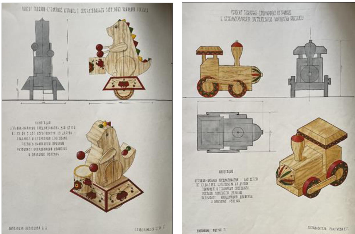
Рис. 8,9. Проекты народных игрушек, выполненные студентами Сергиево-Посадского института игрушки

В народных игрушках, как правило, сюжетами служит окружающая действительность или образы сказочных персонажей. Для народной игрушки характерны упрощенность и ритмичность форм, яркость и в то же время сдержанность в цвете.