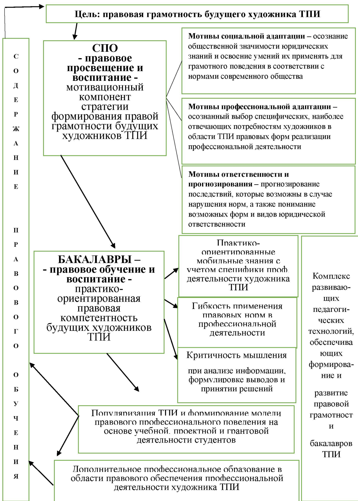
Рис. 2. Структура стратегии правового образования и формирования правовой грамотности будущих художников традиционных художественных промыслов

понимать существо проблемы, с которой он может столкнуться после окончания обучения, но и уметь решить ее практически. Таким образом, стратегию формирования правовой грамотности можно представить в виде структуры на рисунке 2.