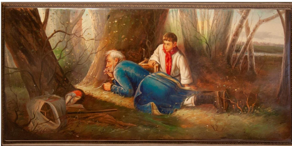
Рис. 3. Зерцалов П.Г. Панно «Птицеловы». Копия с работы В.Г. Перова

Большую часть жизни Петр Геннадьевич посвятил Федоскинской фабрике лаковой миниатюрной живописи. Был ответственным, серьезным, уважаемым человеком и хорошим художником. Много сюжетов лаковой миниатюры он написал за 49 лет работы на фабрике – многочисленные портреты вождей, жанровые композиции, пейзажи, миниатюрные копии работ передвижников: «Птицеловы», «Рыболов», «Охотники на привале» В.Г. Перова, «Боярыня у плетня» К.Е. Маковского, «Аленушка» В.М. Васнецова; федоскинские композиции: тройки, хороводы, чаепития, и авторские композиции на тему природы и охоты (рис. 3).