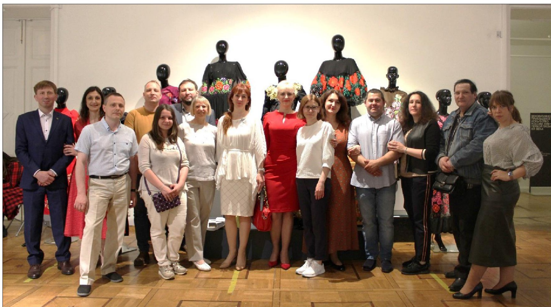
Рис. 1. Коллектив Высшей школы народных искусств (академии) на открытии выставки

23 июня 2022 г. во Всероссийском музее декоративного искусства (г. Москва) состоялось торжественное открытие выставки Высшей школы народных искусств (академии) «Великолепие художественного наследия России» (рис. 1).