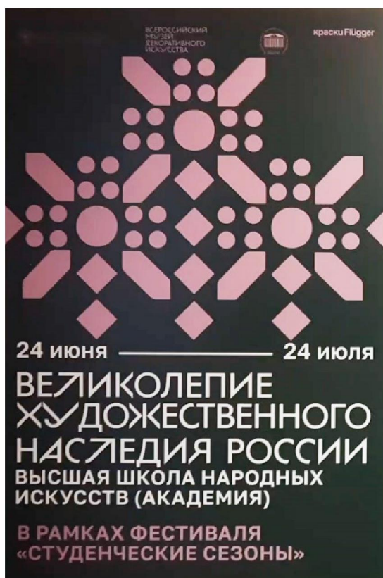
Рис. 2. Афиша выставки