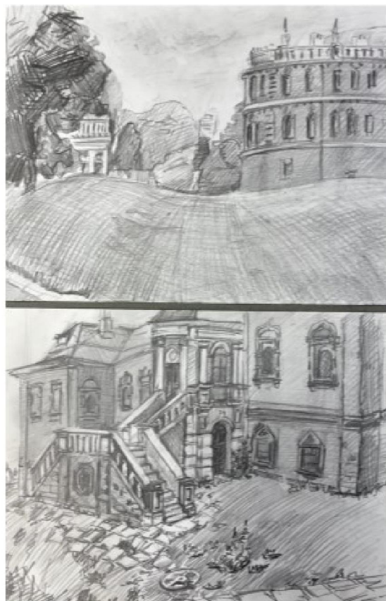
Рис. 2-3. Учебная работа Рослова Д., 2 курс СПО. Бумага/мягкий карандаш, 2021 г.