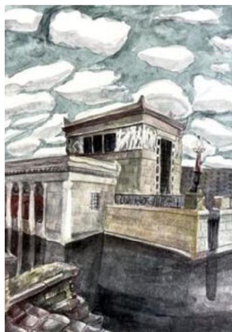
Рис. 5. Учебная работа Белокуровой Т., 2 курс СПО. Бумага/акварель, 2020 г.