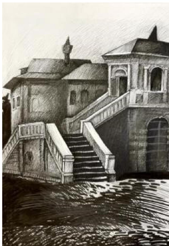
Рис. 7. Учебная работа Петкова Д., 2 курс СПО. Бумага/ карандаш/акварель/водный маркер, 2021 г.