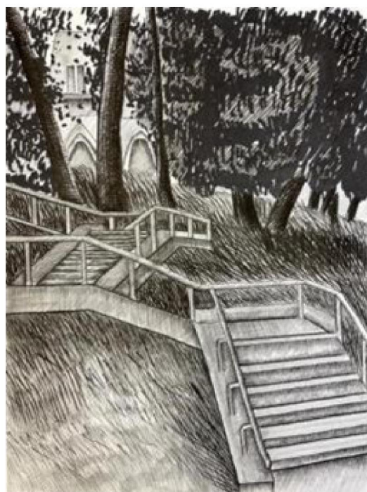
Рис. 9. Учебная работа Петкова Д. 2 курс СПО. Бумага/ карандаш/ спиртовой маркер, 2021 г.

Педагогические условия, созданные во время проведения пленэрной практики, стимулирующие «раскованное рисование», позволяют студентам