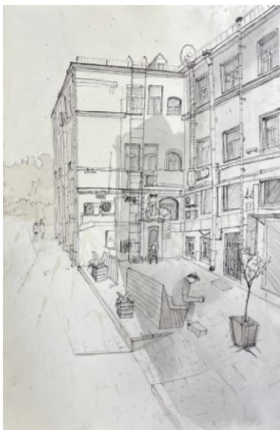
Рис. 1. Учебная работа Рослова Д., 2 курс СПО. Бумага/акварель/тушь/перо, 2021 г.

промыслов (рис.1, 2, 3, 4, 5), т.к., по оценке студентов, данной в ходе беседы, сопровождается самоощущением свободы, защищенности, эмоциональным подъемом, духовным переживанием прекрасного и влияет на физиологическое и психологическое состояние обучающегося.