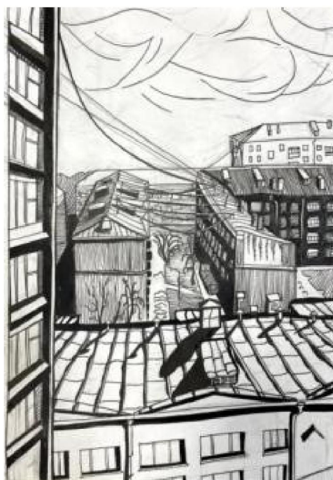
Рис. 4. Учебная работа Белокуровой Т., 2 курс СПО. Бумага/тушь/перо/кисть, 2020 г.