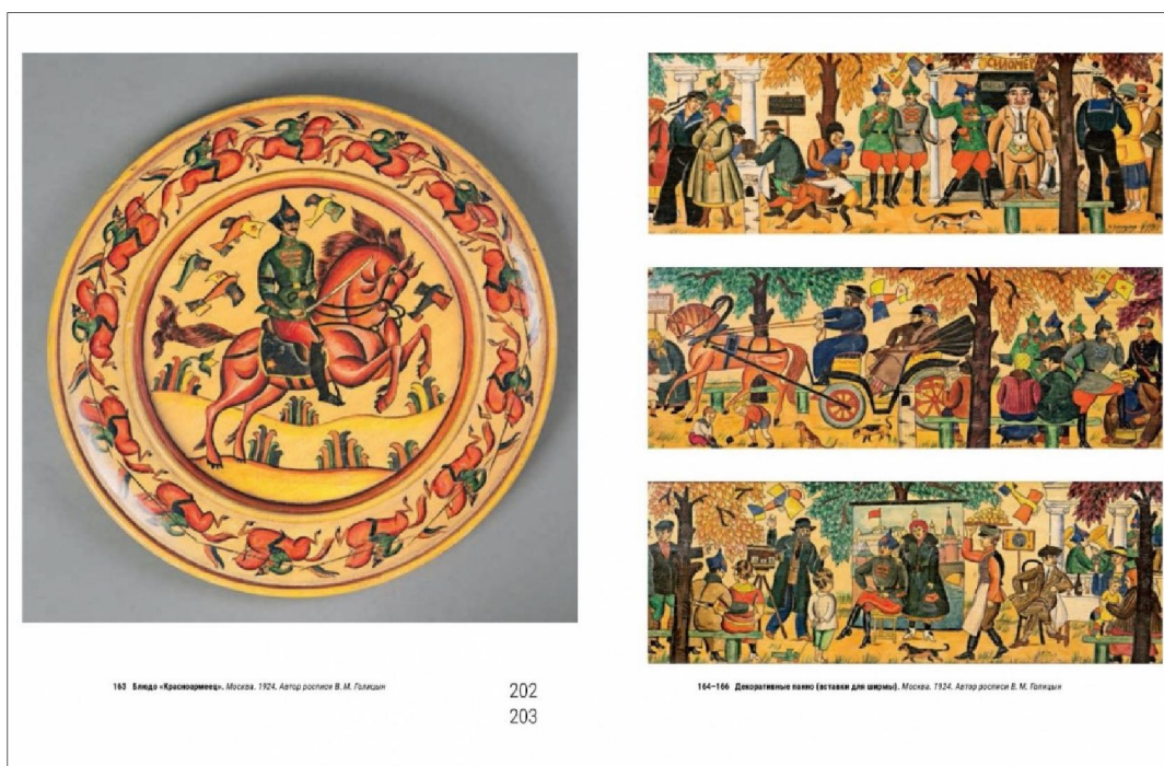
Рис. 6. Экспонаты коллекции Кустарного музея, выполненные по проектам художников

Основную часть книги дополняют приложения – биографии художников Московского кустарного музея, хроника его работы в 1882-1931 гг. (по архивным материалам), обзор выставок с участием музея.