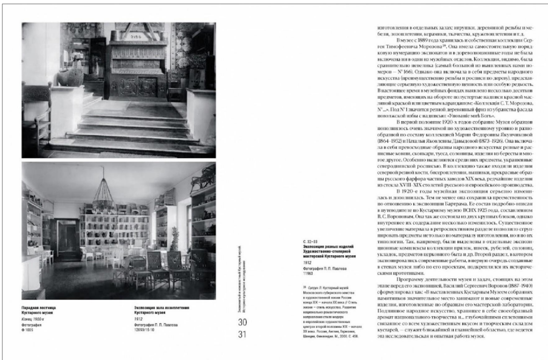
Рис. 2. Разворот издания «Знаменитый и неизвестный Кустарный музей. Из собрания Всероссийского музея декоративного искусства»