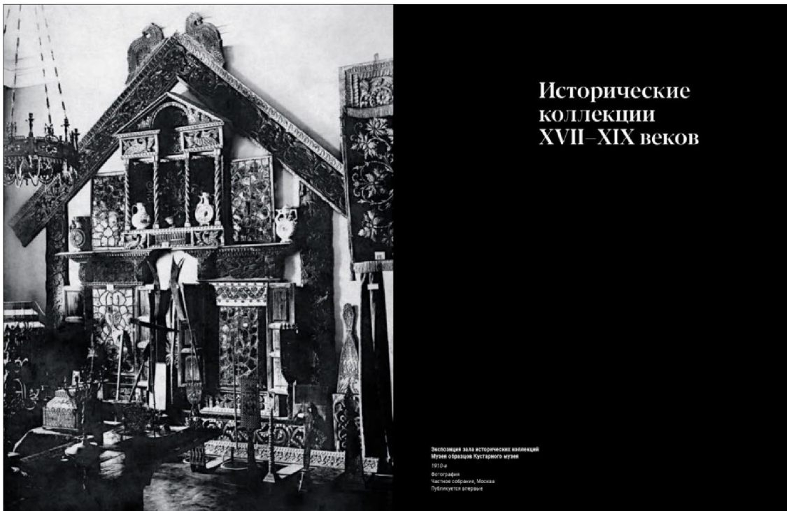
Рис. 3. Альбом издания «Знаменитый и неизвестный Кустарный музей. Из собрания Всероссийского музея декоративного искусства»