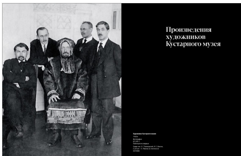
Рис. 5. Альбом издания «Знаменитый и неизвестный Кустарный музей. Из собрания Всероссийского музея декоративного искусства»