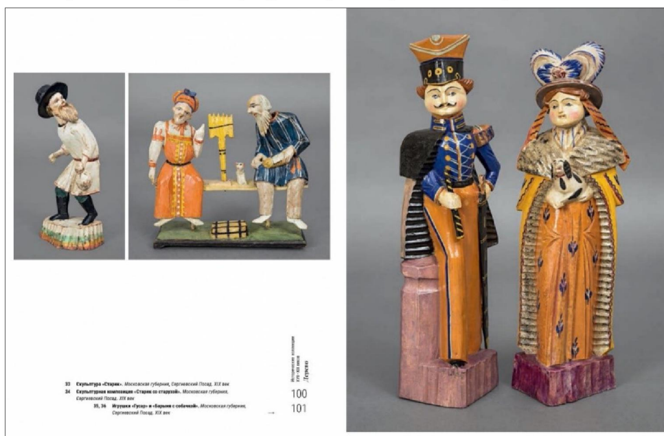
Рис. 4. Экспонаты исторической коллекции Кустарного музея

Историко-культурный очерк в издании дополняет альбом (представлено более 250 предметов), иллюстрации которого поделены на две группы: предметы XVII – XIX вв. исторических коллекций Московского кустарного музея (дерево, кость, керамика, лаковая миниатюра, металл, стекло, бисер, текстиль) (рис. 3-4) и изделия, выполненные по проектам его художников в XX в. (В.М. Голицына, А.Н. Дурново, С.В. Малютина, А.А. Вольтера, Н.Д. Бартрама, Б.Н. Ланге, А.Е. Куликова и др.) (рис. 5-6). Среди иллюстраций как известные произведения художественных промыслов, так и те, которые ранее были знакомы только специалистам – многие экспонаты, архивные документы и фотографии публикуются впервые.