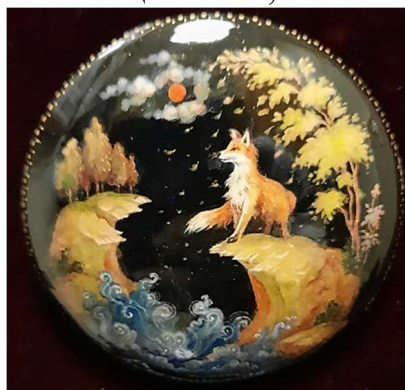
Евстигнеева М. Осенняя рапсодия (палехская лаковая миниатюра)

брошках были изображены животные, насекомые, персонажи литературных произведений, пейзажи, орнаменты во взаимосвязи с осенней тематикой. Конкурсанты проявили творческий подход в колористическом, композиционном, тематическом решении.