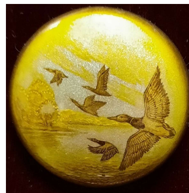
Новожилова И. Летят утки (федоскинская лаковая миниатюра)