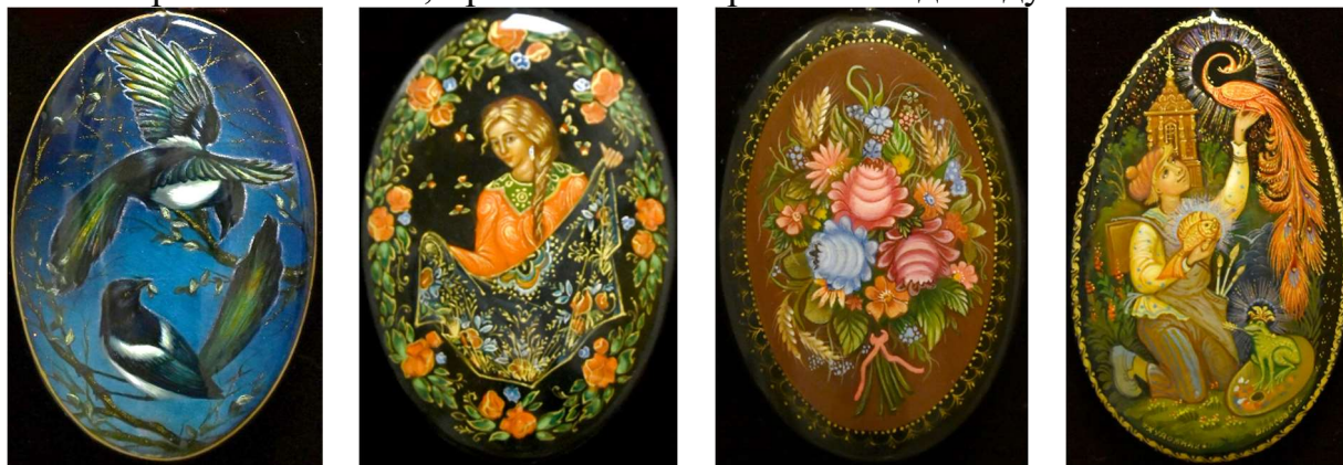
Федоскинская лаковая миниатюрная живопись. Тюрина А. Сороки

и основах цветоведения, технике и технологии выполнения художественной росписи, формируется бережное отношение к традициям искусства лаковой миниатюрной живописи, проявляется творческая индивидуальность.