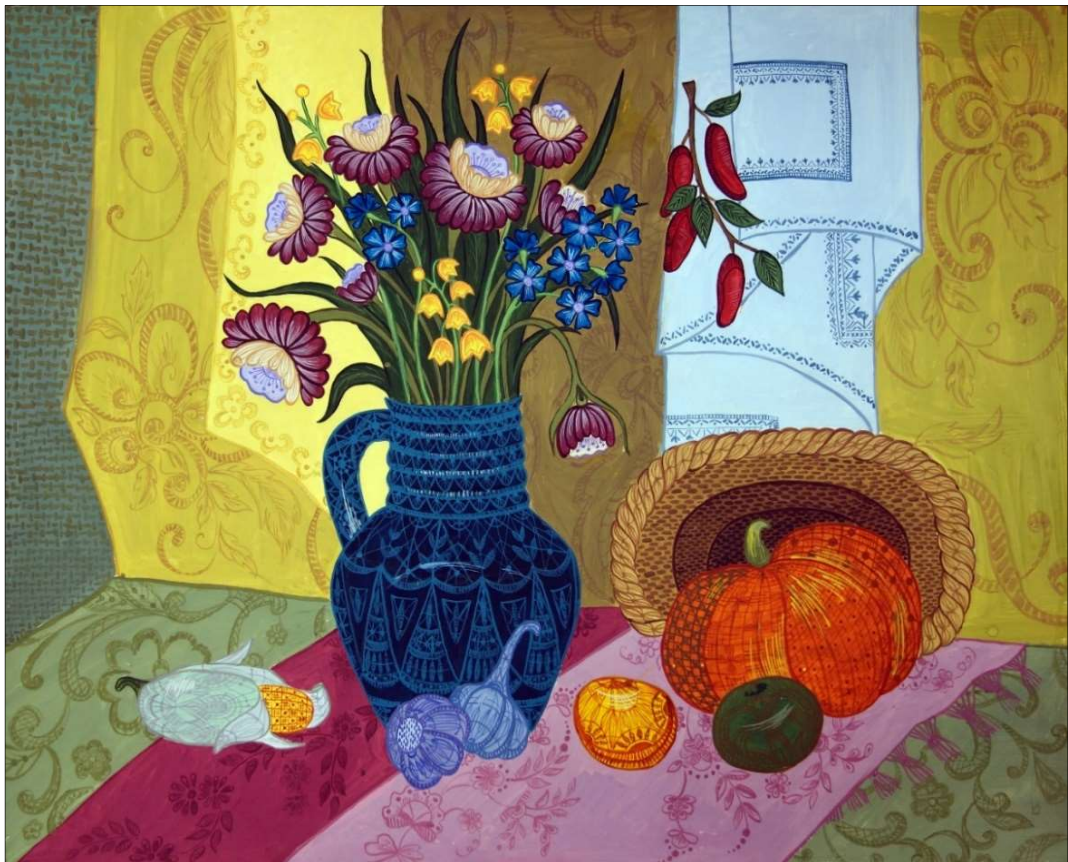
Рис. 6. Декоративное решение натюрморта, соотнесенное с традициями и приемами художественной вышивки