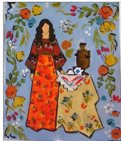
Рис. 4. Выполнение эскизов декоративной переработки этюда женской фигуры в театральном костюме

Преподавание живописи в Высшей школе народных искусств основывается на разделении работы с натуры и декоративную живопись, соотношенную с конкретным видом традиционного прикладного искусства (рис. 3, 4), которая выполняется по воображению, «от себя». В процессе выполнения живописного этюда происходит изучение объектов средствами академической живописи. Таким образом, рисунок и живопись с натуры выполняют конкретную учебно-познавательную роль, а декоративная живопись несет в себе элементы творческого поиска.