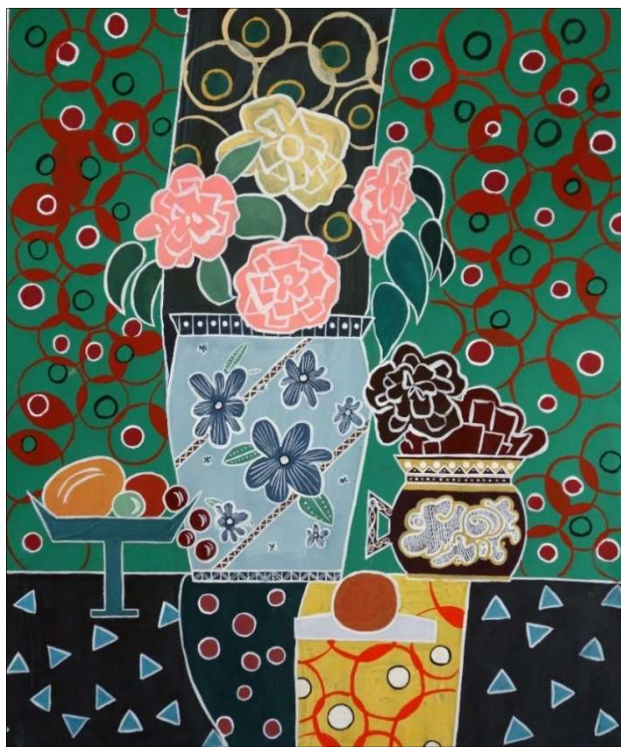
Рис. 1. Декоративно-условное решение натюрморта

После выполнения работы с натуры выполняется декоративная переработка живописного этюда. Проблемы композиционной и декоративно-условной целостности учебной работы стоят перед студентом вне зависимости от того, идет речь о кратком наброске или этюде с натуры, многосеансном учебном задании или стилизованном изображении для проекта изделия. А значит, отличие декоративного художественного изображения от любого иного состоит как раз в таком качестве, как стилизация и условность [5, с. 48]. Традиционным художественным промыслам, не изображающим реалистичные образы (например, художественному кружеву), также свойственно обладать фундаментальными композиционными закономерностями, такими как: композиционный центр, симметрия и асимметрия, статика и динамика (рис. 1).