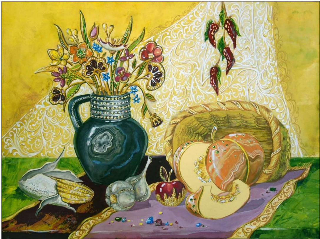
Рис. 5. Декоративное решение натюрморта, соотнесенное с традициями и приемами ювелирного искусства