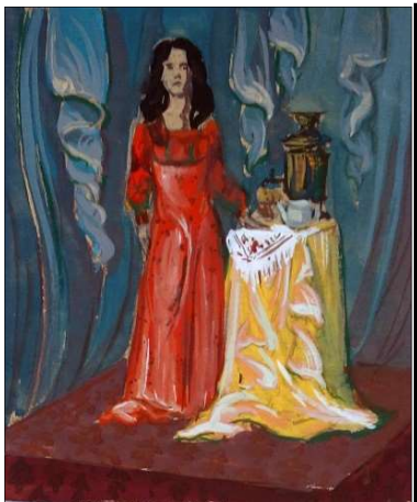
Рис. 3. Декоративная переработка этюда женской фигуры в театральном костюме, соотносенная с традициями и приемами лаковой миниатюрной живописи