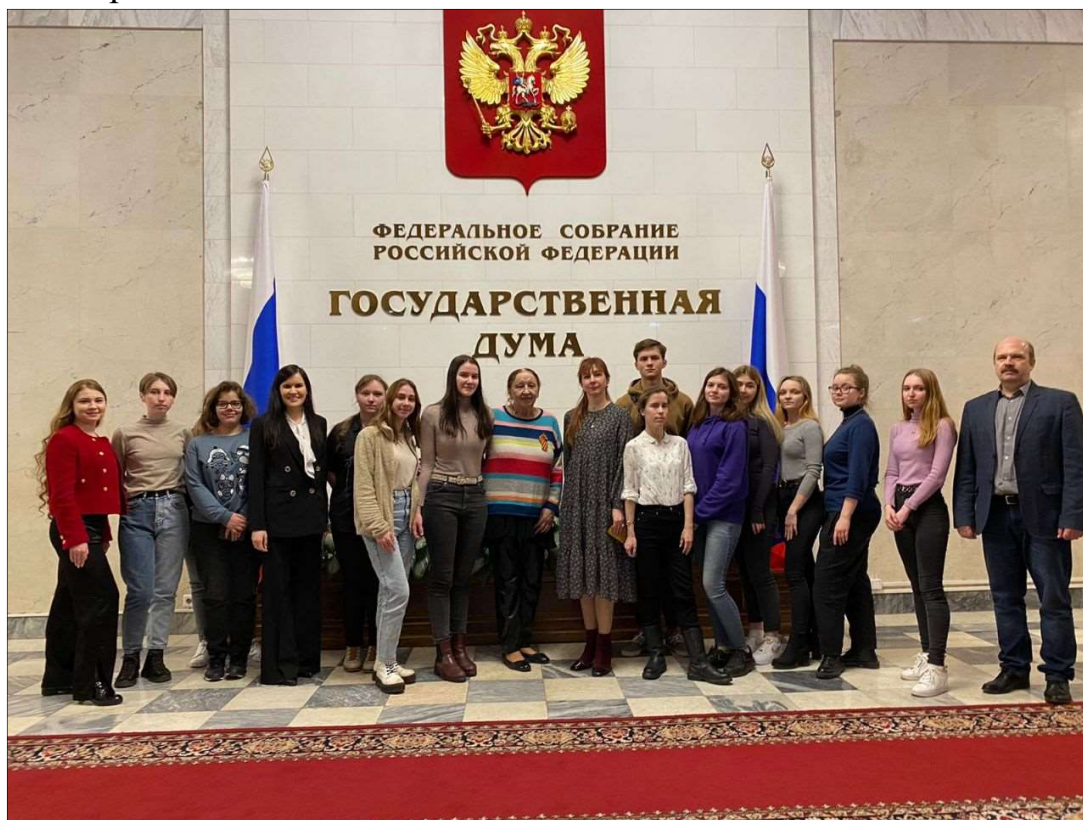
Рис. 1. Посещение Государственной Думы студентами Высшей школы народных искусств (академии)

К примеру, посещение здания Государственной Думы Федерального Собрания Российской Федерации (рис. 1) позволило студентам воочию познакомиться с работой профильного комитета по культуре, пообщаться с разработчиками законодательных инициатив, сопоставить свое представление о законодательной деятельности Думы с реальной деятельностью парламентариев.