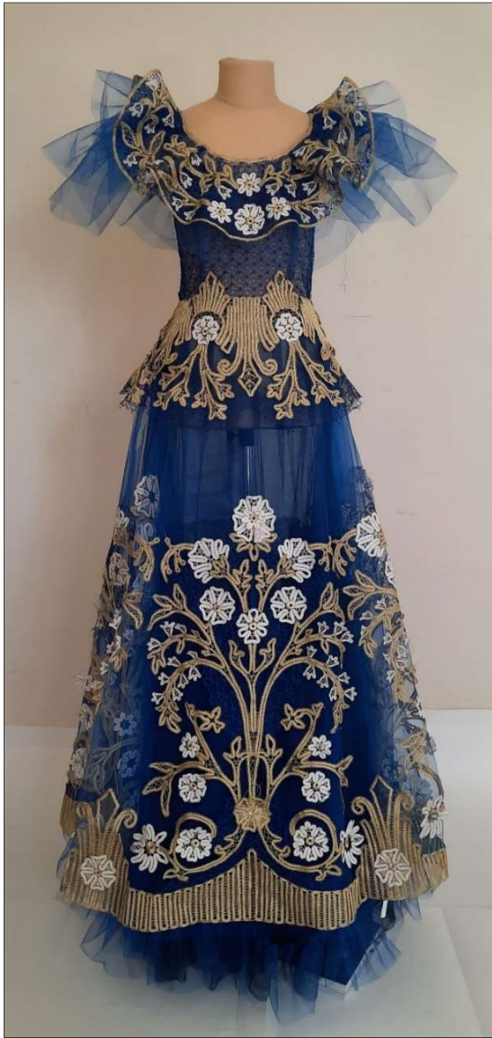
Рис. 3. А. Ковтун. Платье «Роскошь императорских садов». Высшая школа народных искусств, 2021