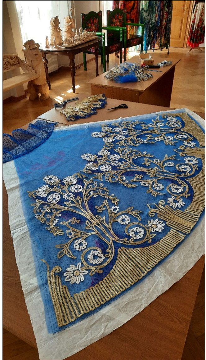
Рис. 7. Подготовка к пришиванию кружевных элементов к сетчатому фону юбки платья

Кружевное платье «Гирлянды янтаря», автор К. Бондарева, выполнено в технике аппликация кружева по тюлю с использованием сцепной и бельгийской техник плетения (рис. 8). На черном прозрачном фоне многослойной сетки богато располагаются золотые цветочные гирлянды. Кружево выполнено золотыми нитками двух оттенков: светлого и темного золота. В сердцевины цветов включены обтянутые золотой нитью пайетки. Орнамент украшен стеклянными камнями медового цвета. Автору удалось передать прозрачность и воздушность кружевного полотна, несмотря на контрастность материалов. Вырез горловины художественного произведения решён цветочным колье с пышным букетом, по плечам располагаются кружевные веера из листьев, выполненных в бельгийской технике «дюшес».