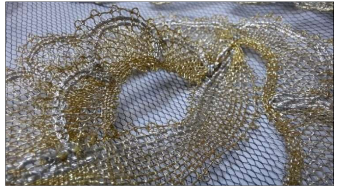
Рис. 9. Фрагмент двухслойного цветка

составляющее платья очень разнообразно: переплетающиеся ленты, распустившиеся ромашки, лютики, садовые розы, листья, ягоды на веточках тончайшего исполнения. В данном произведении фоновая кружевная решетка была бы лишней из-за своей структуры и орнаментики, отвлекала бы зрителя от многодельности кружевных мотивов.