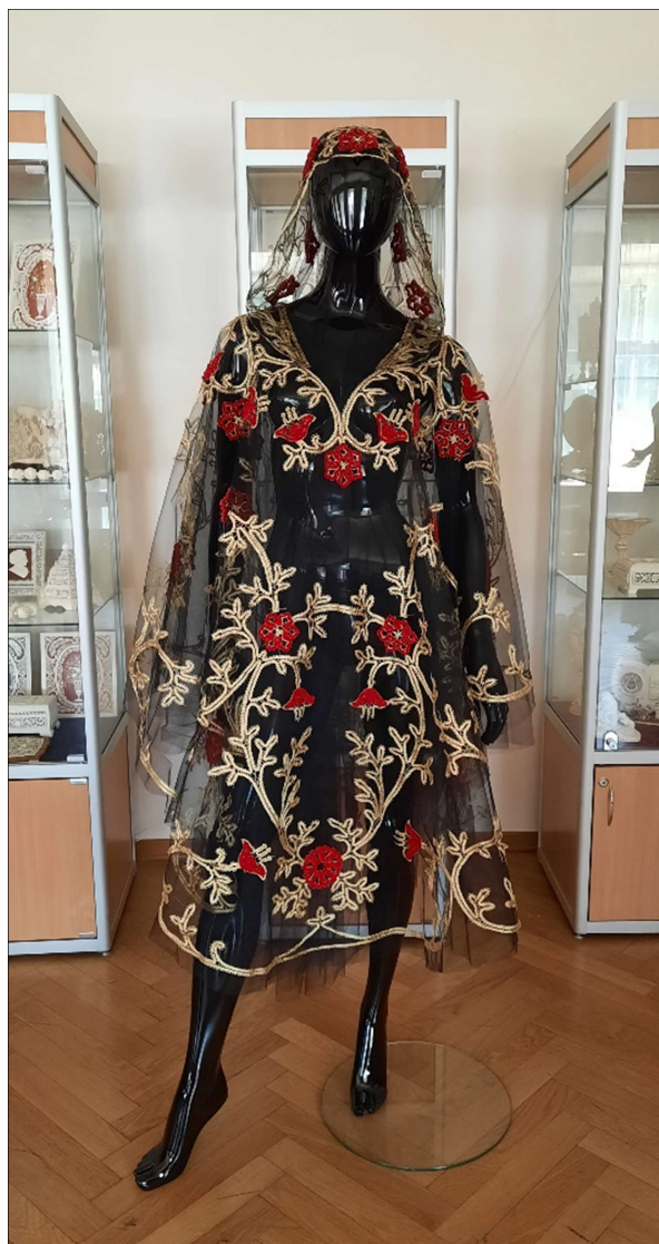
Рис. 5. О. Рыбакова. Накидка с капюшоном «Сплетались золотом пылающие розы». Высшая школа народных искусств, 2022