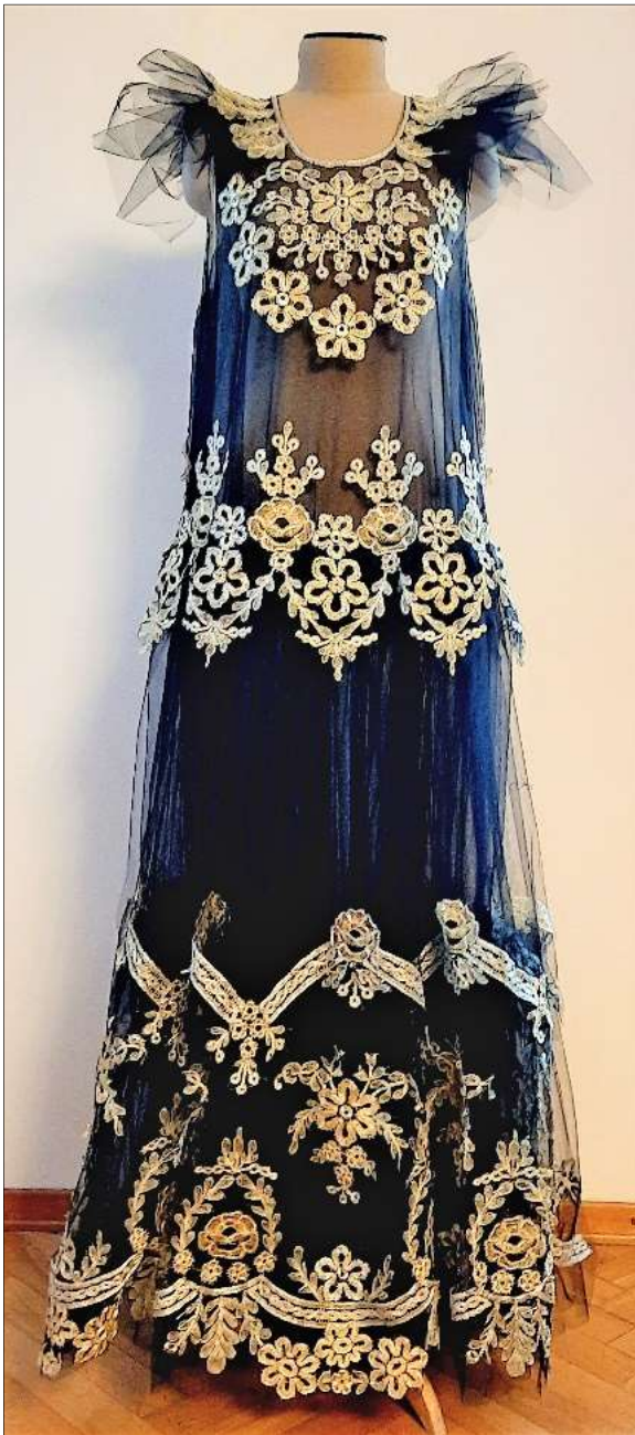
Рис. 8. К. Бондарева. Платье «Гирлянды янтаря». Высшая школа народных искусств, 2021

составляющее платья очень разнообразно: переплетающиеся ленты, распустившиеся ромашки, лютики, садовые розы, листья, ягоды на веточках тончайшего исполнения. В данном произведении фоновая кружевная решетка была бы лишней из-за своей структуры и орнаментики, отвлекала бы зрителя от многодельности кружевных мотивов.