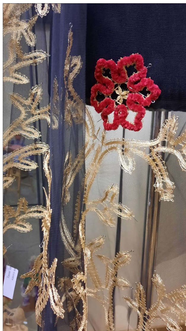
Рис. 4. Фрагмент прикрепления кружевных элементов к готовой сетке