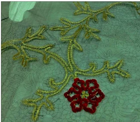
Рис. 9. Соединение готовых фрагментов кружева с сеткой в соответствии со сколком будущей дипломной работы

7. Булавки из кружева вынимать сразу после их закрепления с сеткой.