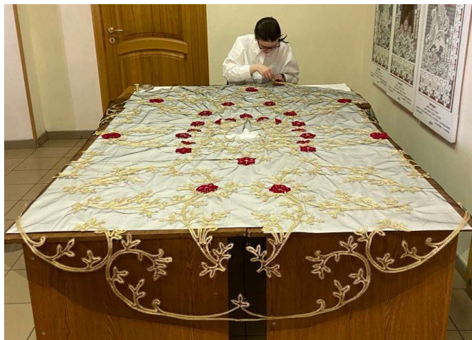
Рис. 8. Пришивание готовых мотивов кружева к сетке

Данную технологию аппликации кружева можно применить и на других материалах: бархате, коже, шёлке, ситце, льне, шерсти, мехе и т.д.