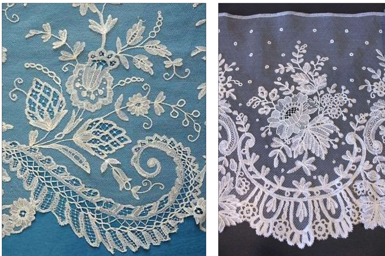
Рис. 2-3. Примеры аппликации кружева по тюлю

Несколько столетий назад художники по кружеву предприняли попытку, которая впоследствии стала успешной, соединить кружевные мотивы, выполненные на коклюшках и готовый сетчатый фон, иногда добавляя в кружево вышитые иглой мотивы. Кружевные изделия с включением фабричной сетки приобрели новый вид и время на их изготовление значительно сократилось (рис. 2-5).