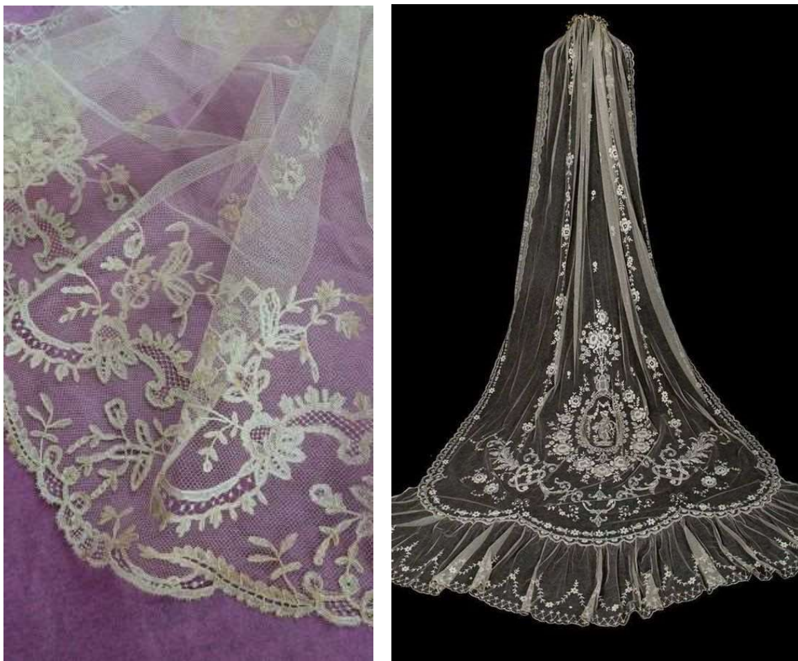
Рис. 4-5. Примеры аппликации кружева по тюлю

плетеной решеткой, пришло в связи с жатыми сроками на его выполнение (рис. 6-7).