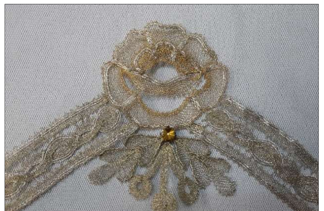
Рис. 10. Фрагмент пришитых к сетке мотивов кружева