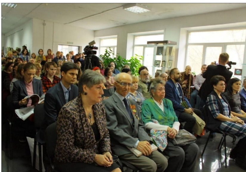
Рис. 1. Торжественное открытие музейно-выставочного пространства «Лукутинские традиции»

В рамках реализации проекта «Лукутинские традиции», направленного на сохранение и изучение уникальной коллекции лаковой миниатюрной живописи XIX века, при поддержке АИС Молодежь России 14 октября 2022 года в Федоскинском институте лаковой миниатюрной живописи состоялось торжественное открытие музейно-выставочного пространства (рис. 1) и презентация каталога «Коллекция лукутинских изделий А.С. Мокроусова – жемчужина музейного фонда Федоскинского института лаковой миниатюрной живописи».