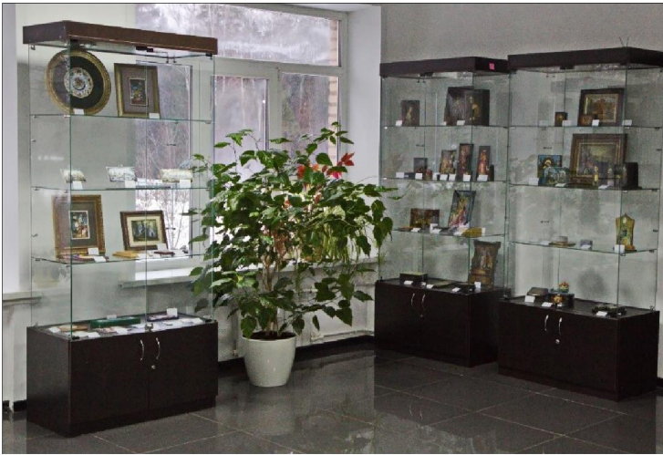
Рис. 7. Фрагмент выставки «Лукутинские традиции». Художественная роспись по эмали

снова предстала во всем великолепии перед зрителями и ценителями лакового искусства.