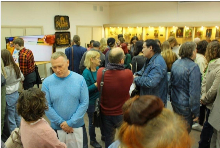
Рис. 8. Экскурсия в выставочном зале федоскинской лаковой миниатюрной живописи

снова предстала во всем великолепии перед зрителями и ценителями лакового искусства.