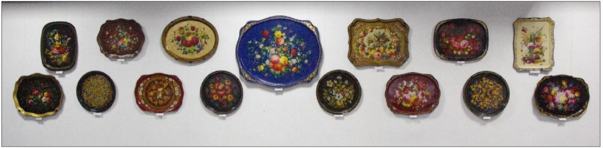
Рис. 6. Фрагмент выставки «Лукутинские традиции». Жостовская художественная роспись по металлу