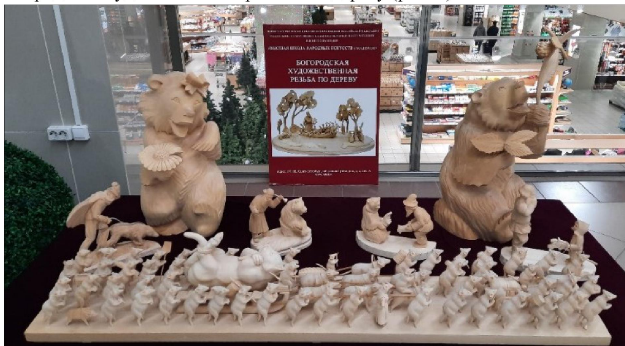
Рис. 1. Богородская художественная резьба по дереву. Выпускные квалификационные работы студентов Высшей школы народных искусств (академии)

С 04.11.2022 по 06.11.2022 г. в г. Киров в ТЦ «Время простора» проходил Межрегиональный форум народных художественных промыслов «Кладовая ремёсел». Высшая школа народных искусств (академия) представила выставку выпускных квалификационных работ студентов – 56 произведений художественной вышивки, художественного кружевоплетения, лаковой миниатюрной живописи, нижнетагильской росписи по металлу и богородской художественной резьбы по дереву (рис. 1).