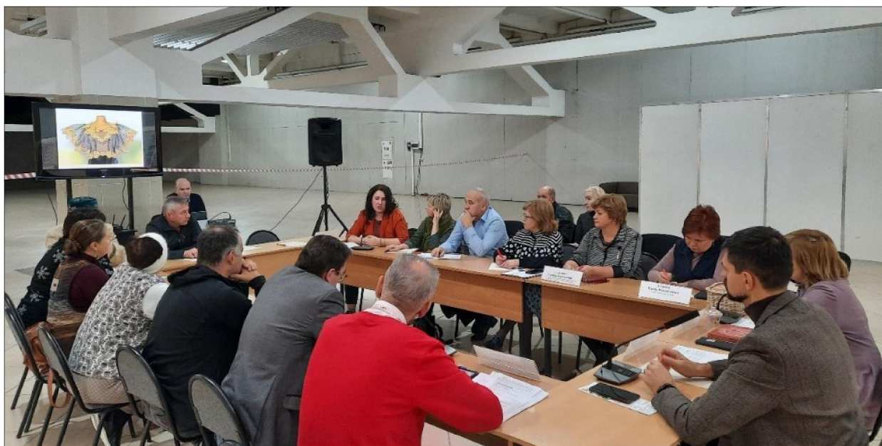
Рис. 4. Круглый стол. Презентация Высшей школы народных искусств (академии)

Губернатор Кировской области А.В. Соколов поставил региональному правительству и отраслевым органам исполнительной власти задачу оказания всесторонней поддержки развитию традиционных художественных промыслов, поскольку все они работают на бренд региона.