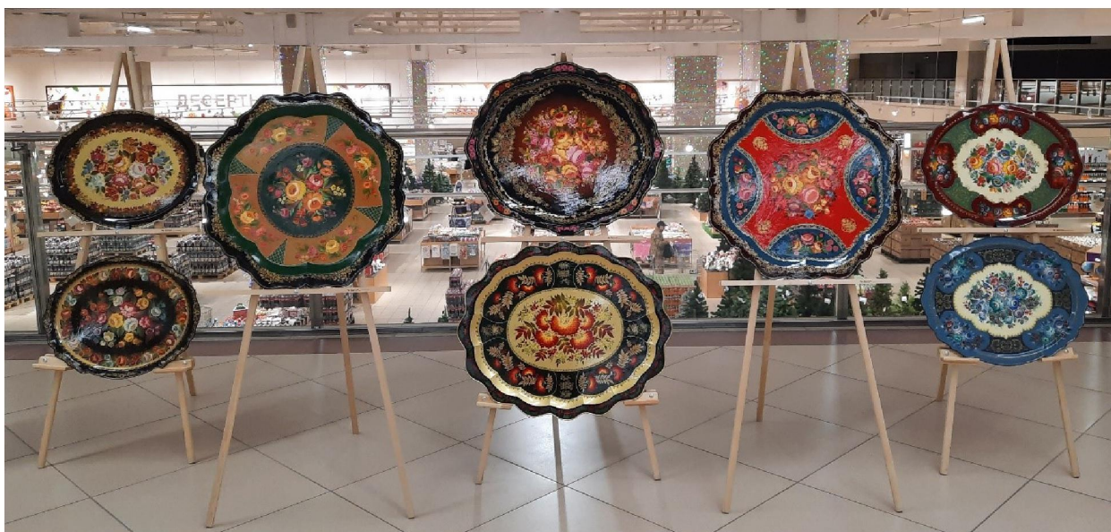
Рис. 5. Выпускные квалификационные работы студентов кафедры декоративной росписи Высшей школы народных искусств (академии). Нижнетагильская маховая роспись по металлу