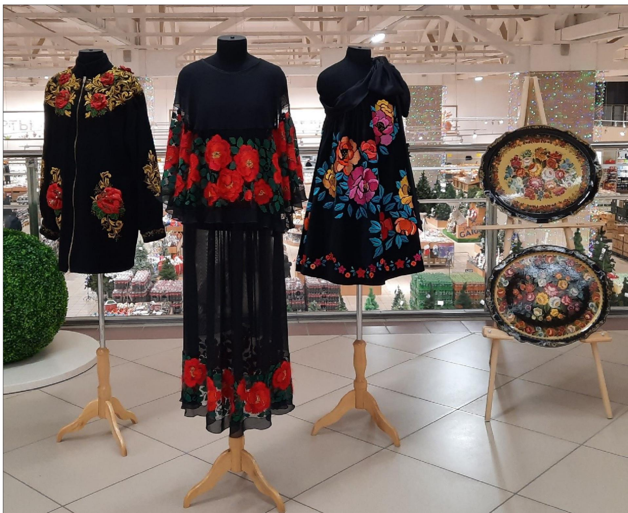
Рис. 6. Выпускные квалификационные работы студентов кафедры художественной вышивки Высшей школы народных искусств (академии)

Выставка «Великолепие художественного наследия России» Высшей школы народных искусств (академии) в г. Киров сыграла значимую роль в контексте сохранения и развития отечественных художественных традиций и пополнила события, проводимые в рамках Года культурного наследия народов России.