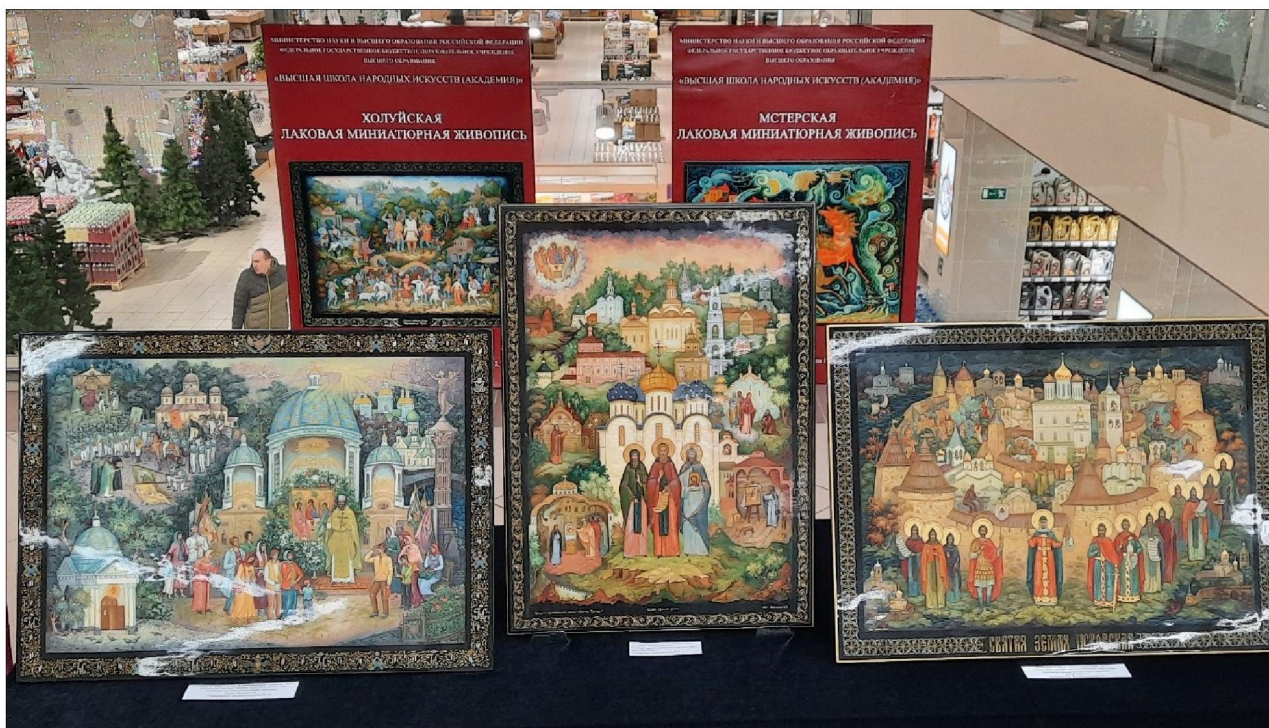
Рис. 1. Выпускные квалификационные работы студентов кафедры лаковой миниатюрной живописи Высшей школы народных искусств (академии)

Программа форума включала круглый стол, мастер-классы, презентации, концертную программу. На круглом столе была проанализирована перспектива открытия в г. Кирове филиала Высшей школы