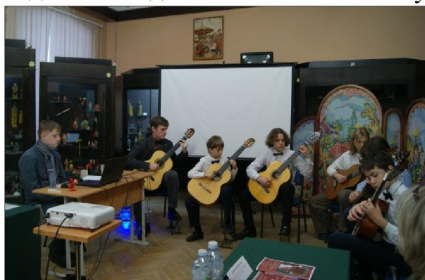
Рис. 3. Выступление учащихся МБУ ДО «Детская школа искусств № 8»

Открытие конференции сопровождалось музыкальным приветствием учащихся Муниципального бюджетного учреждения дополнительного образования «Детская школа искусств № 8», г. Сергиев Посад. Игрушка и музыка всегда вместе, они сближают людей в стремлении к миру, дружбе, соединяют в единый поток мысли и чувства (рис. 3-4).