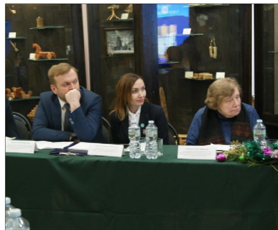
Рис. 5, 6. Участники Международных XIV Бартрамовских чтений