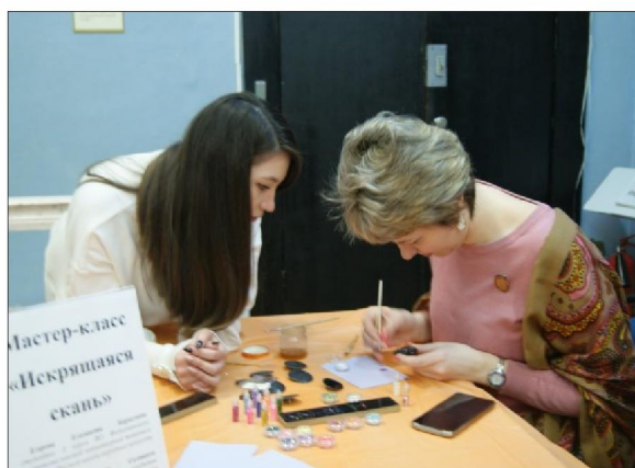
Рис. 2. Мастер-класс по изготовлению различных видов игрушек

Открытие конференции сопровождалось музыкальным приветствием учащихся Муниципального бюджетного учреждения дополнительного образования «Детская школа искусств № 8», г. Сергиев Посад. Игрушка и музыка всегда вместе, они сближают людей в стремлении к миру, дружбе, соединяют в единый поток мысли и чувства (рис. 3-4).