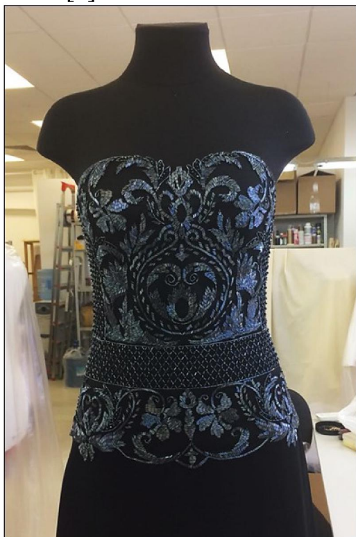
Рис. 4. Корсет платья бренда OliaVictorieva, с вышивкой, выполненной выпускниками ИТПИ ВШНИ

Многие выпускники Института традиционного прикладного искусства работают в Модном доме У. Сергиенко. Техники вышивки, применяемые при декоре моделей – это объемная, белая и цветная гладь, в сочетании с декоративными швами и французскими узелками на различных видах ткани и тюле [7].