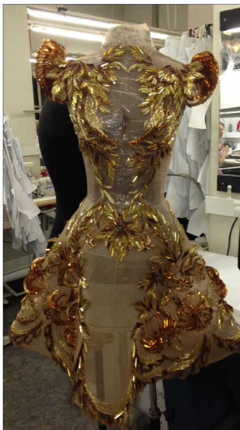
Рис. 5. Платье Дома моды В. Юдашкина, с вышивкой, выполненной выпускниками ИТПИ ВШНИ

способа. Вышивка выполняется гладью, бисерным шитьем, декорируется пайетками и стразами [17].