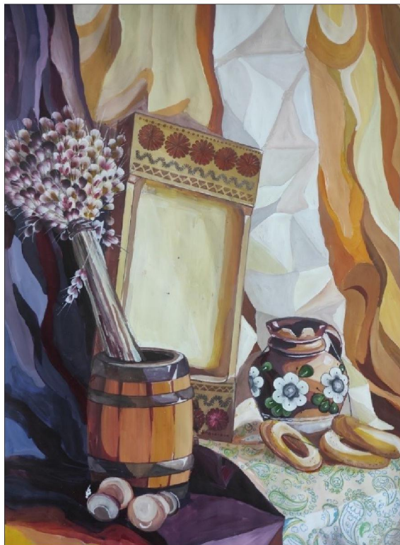
Рис. 7. Декоративный натюрморт

После утверждения эскиза учащийся преступает к переносу работы на планшет размером 50x70. Чем точнее выполнен эскиз, тем проще ведется работа в формате листа (рис. 7).