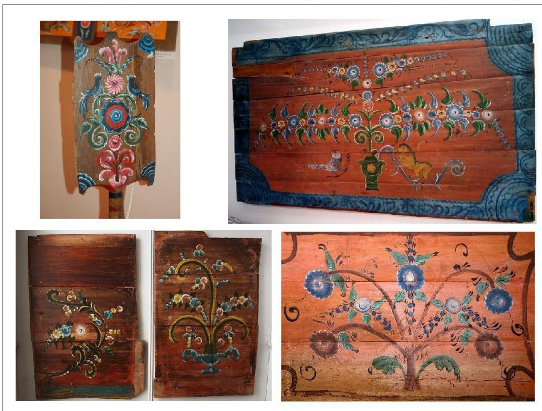
Рис. 1. Урало-сибирская роспись. Омский областной музей изобразительных искусств им. М.А. Врубеля

совокупности с композицией орнамента, дает возможность создания уникальных изделий. Об этом свидетельствуют выпускные квалификационные работы студентов Сибирского института традиционного прикладного искусства, которые дают возможность проследить обогащение цветовой палитры традиционных мотивов урало-сибирской росписи (рис. 2).