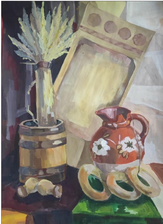
Рис. 4. Реалистичный живописный этюд натюрморта