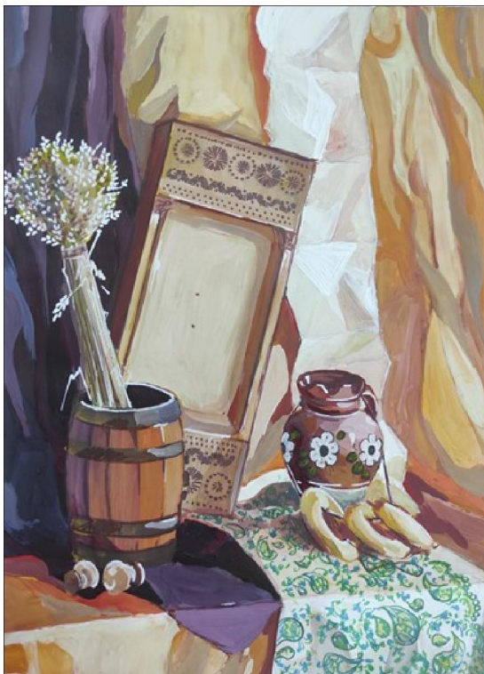
Рис. 5. Эскиз в цвете

силу тона и насыщенность цвета. Грамотное применение линии, ее толщины и количества, необходимо для создания завершенной композиции, как в декоративной живописи, так и в работе над произведениями в технике уралосибирской росписи.