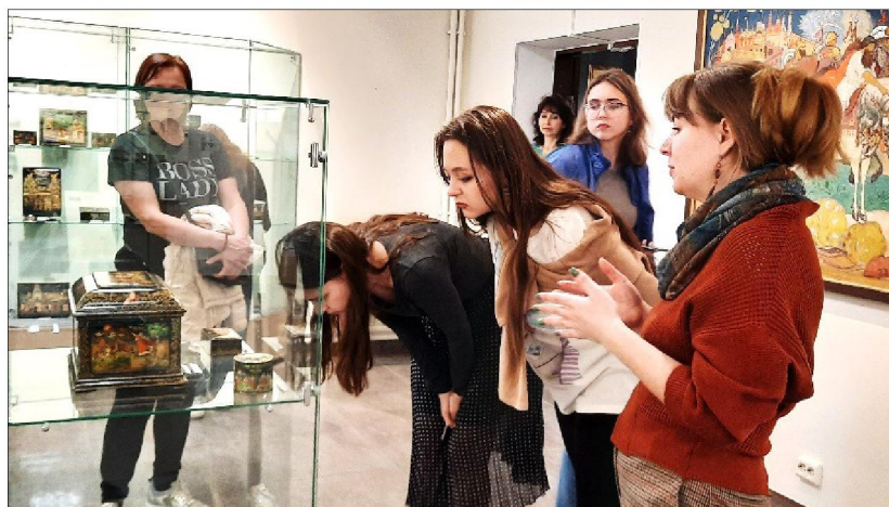
Рис. 10. Государственный музей Палехского искусства

Основная коллекция икон, представленная в музее, выполнена палехскими художниками; также в экспозицию входят иконы, выполненные иконописцами Костромы, Новгорода, Холуя, Вологды и др.