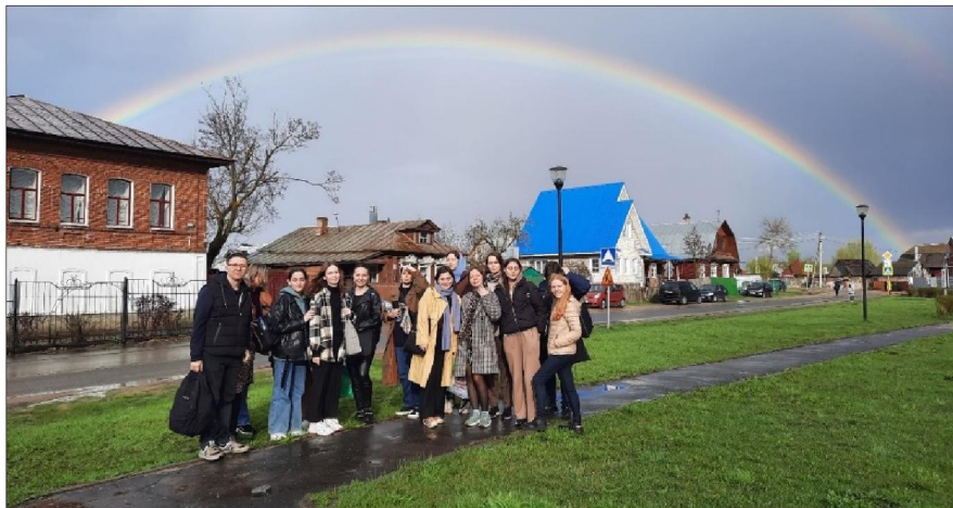
Рис. 8. Студенты кафедры лаковой миниатюрной живописи в Холуе