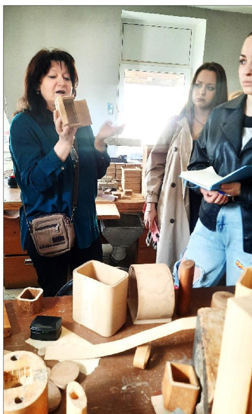
Рис. 5. Федоскинская фабрика миниатюрной живописи

Студенты посетили Музей художественных промыслов – филиал государственного автономного учреждения культуры Московской области «Объединенный мемориально-