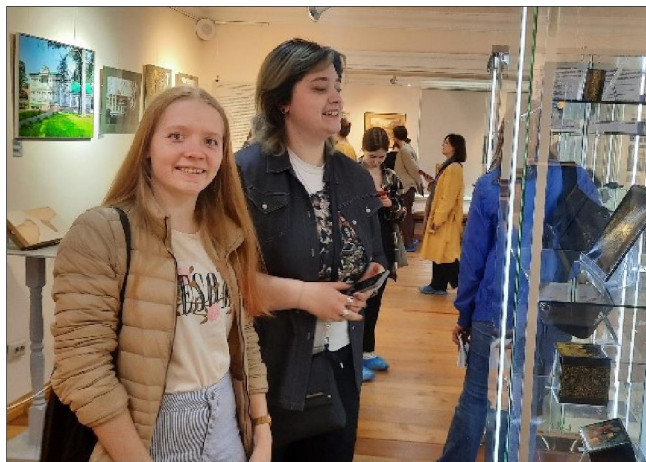
Рис. 4. Музей художественных промыслов

В экспозиции также представлены современные работы студентов института, преимущественно выпускные квалификационные работы, что дает возможность проследить этапы развития федоскинской лаковой миниатюрной живописи от ее зарождения до нашего времени.