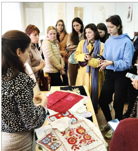
Рис. 7. Холуйский институт лаковой миниатюрной живописи им. Н.Н. Харламова фабрика лаковой миниатюрной живописи

Знакомство и общение с выдающимся художником является для студентов очень ценными и важными. Такие встречи позволяют им соприкоснуться особенностями творчества авторов-создателей произведений искусства, узнать, как они достигли высокого уровня мастерства, как развили свою особую художественную манеру письма, расширить знания о творческой биографии художников.