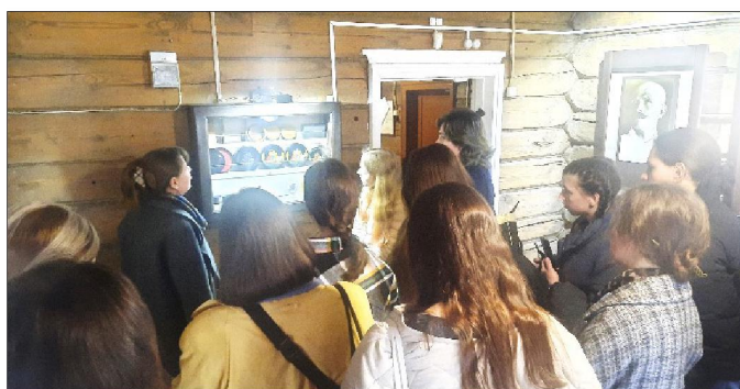
Рис. 9. Дом-музей Голикова И.И.

В залах Государственного музея Холуйского искусства были представлены экспозиции, посвященные юбилейным датам заслуженных художников Российской Федерации Дмитриева С.М. и Митяшина П.А. Изучение их произведений позволило студентам выявить индивидуальную манеру письма каждого и расширить знания о творчестве художников.