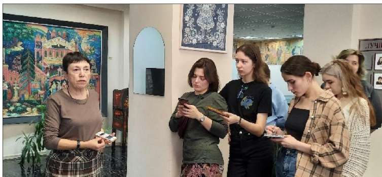
Рис. 11. Мстёрский институт лаковой миниатюрной живописи им. Ф.А. Модорова