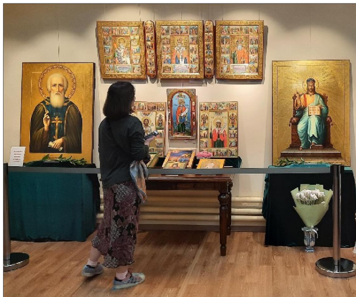
Рис. 12. Мстёрский художественный музей

Студенты ознакомились с учебными аудиториями, в которых обучают мстёрской иконописи и лаковой миниатюрной живописи, традиционной мстёрской вышивке (белая гладь, русская гладь, владимирский верхшов и возрождаемая институтом цветная гладь); с домовою церковью Покрова Пресвятой Богородицы, иконы, находящиеся в ней, выполнены студентами института; художественно-конструкторской лабораторией по изготовлению изделий из папье-маше; музеем, который содержит в себе коллекцию выпускных квалификационных работ студентов института.