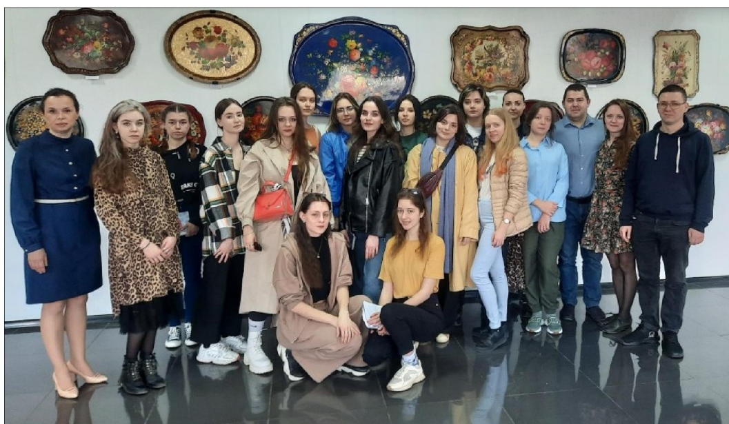
Рис. 1. Студенты кафедры лаковой миниатюрной живописи ВШНИ в Федоскинском институте лаковой миниатюрной живописи

октября 2022 года в Федоскинском институте лаковой миниатюрной живописи» [3, с. 8].