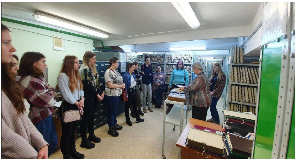
Рис. 2. Посещение национального хранилища Государственного патентного фонда студентами Института традиционного прикладного искусства

Во время практического занятия по патентной документации и методике патентного поиска будущие художники традиционных художественных промыслов получили представление о деятельности Государственного патентного фонда – национального хранилища и крупнейшего центра патентной информации (рис. 2), а также углубили знания о региональных брендах России, которые являются объектами государственной охраны как объекты интеллектуальной собственности (рис. 3, 4) [7].