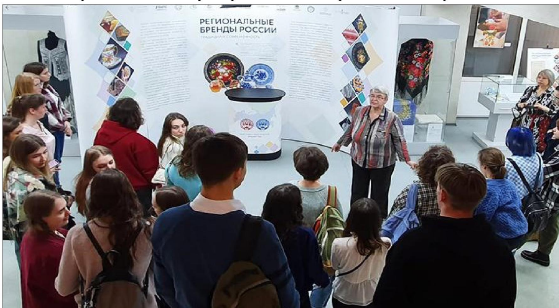
Рис. 3. Знакомство с выставкой «Региональные бренды России: традиции и современность», значительная часть которой посвящена изделиям народных промыслов, зарегистрированных как наименования мест происхождения товаров и географические указания.