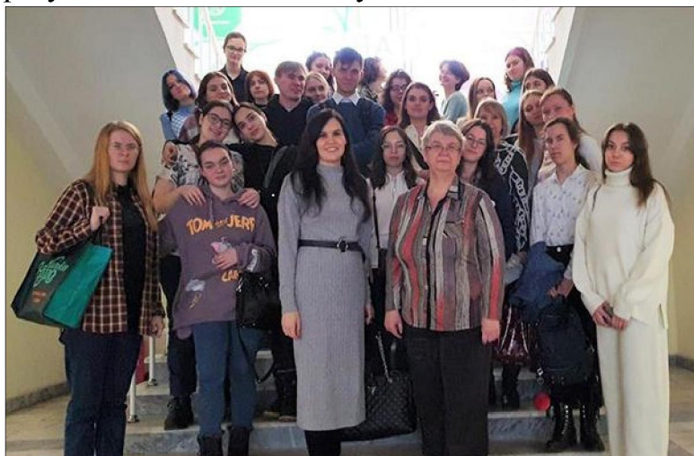
Рис. 1. Посещение Всероссийской патентно-технической библиотеки студентами Института традиционного прикладного искусства

Важным элементом для учета становится также и то, что предприятия народных художественных промыслов обладают уникальными технологиями – объектами интеллектуальной собственности, среди которых в том числе стилевые особенности, технологии реза, сушки, плетения и прочих технологических характеристик. Поэтому особое внимание в рамках реализации практико-ориентированного подхода отведено и правовой охране результатов интеллектуальной деятельности, ключевые нормативные