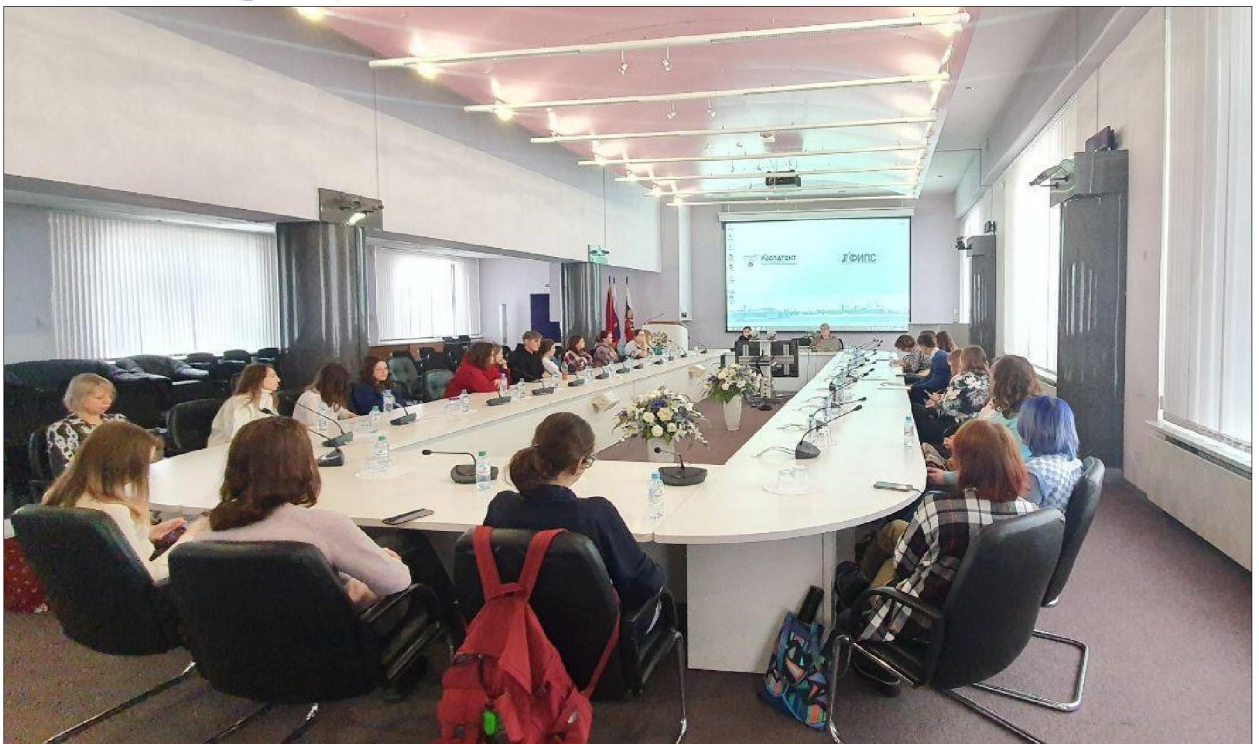
Рис. 5. Практическое занятие по патентному поиску по темам, связанным с технологиями, материалами и оборудованием, применяемыми в народных художественных промыслах

Студенты отметили, что знакомство на практике послужило проводником в мир интеллектуальной собственности. Большинство признались, что никогда ранее не задумывались о сути данной сферы защиты своих прав, в том числе применительно к будущей профессиональной деятельности (рис. 5).