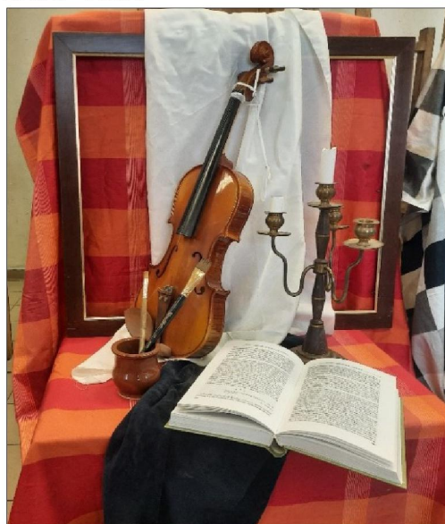
Рис. 6. Постановка тематического натюрморта «Музыка»

Масштаб и форма предметов в натюрморте играют важную роль. Предметы в одном натюрморте должны пропорционально соотноситься между собой. Очень большие или маленькие предметы в одной постановке будут разрушать целостное восприятие натюрморта. Предметы должны быть разнообразными по форме и приближаться к простым геометрическим формам (шар, куб, конус, цилиндр и т.д.). В результате натюрморт, составленный из разнообразных по форме, фактуре и масштабу предметов, объединённых одной темой, даст возможность более эффективно изучать