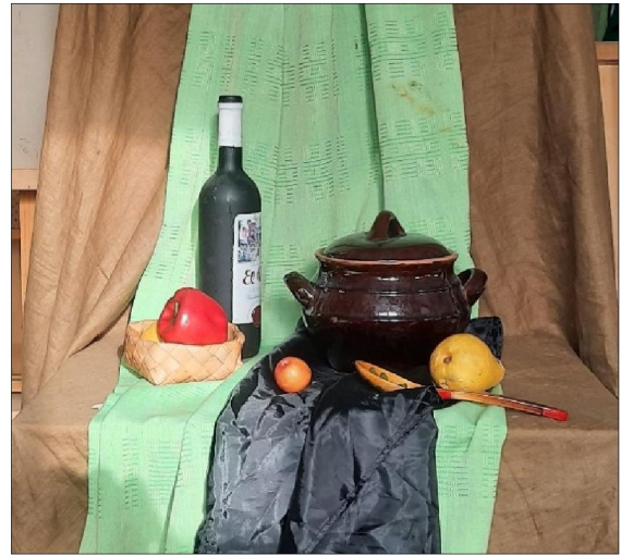
Рис. 2. Постановка простого натюрморта с фронтальным освещением