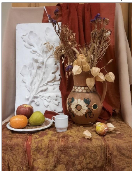
Рис. 5. Постановка натюрморта с драпировками и предметами различных фактур

При организации постановки внимание обращается на стилистическое единство всей постановки, которое достигается использованием предметов, объединённых одной темой, например, «Музыка», «Осень», «Античность». Стилистически грамотно составленный натюрморт даст возможность воспитать у студентов чувство композиционной цельности и разовьет композиционное мышление (рис. 6). Изучая в рисунке и живописи натюрморты, составленные из различных по форме, силуэту и фактуре предметов, студенты учатся на практике использовать такие понятия, как ритм и масштаб.