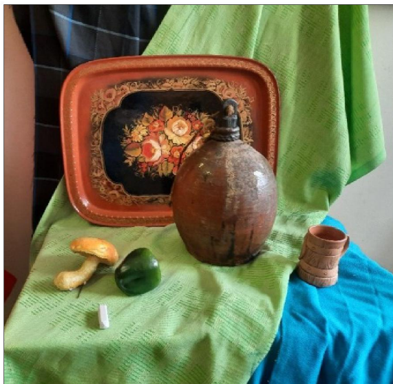
Рис. 7. Постановка натюрморта для профиля «Декоративная роспись по металлу»