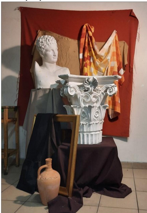
Рис. 3. Постановка тематического натюрморта с искусственным направленным освещением