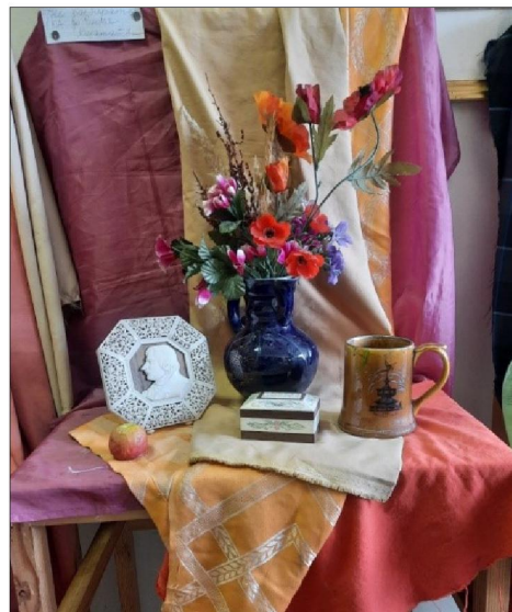
Рис. 8. Постановка натюрморта для профиля «Художественная резьба по кости»

Подводя итог, можно сформулировать основные особенности организации постановок натюрмортов по рисунку и живописи в процессе подготовки будущих художников традиционных художественных промыслов: