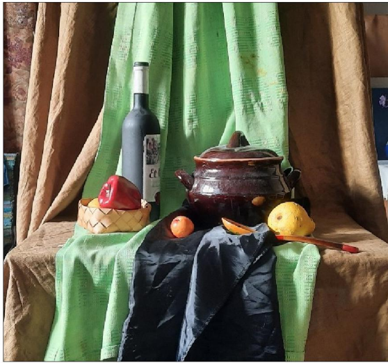
Рис. 1. Постановка простого натюрморта с боковым освещением