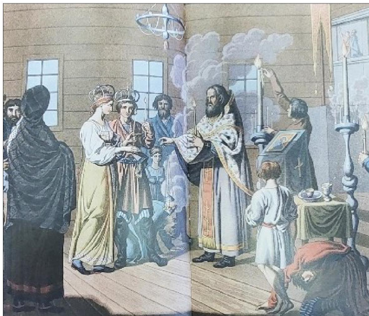
Рис. 4. Иллюстрация «Русская свадьба» из издания К. Рехберга

На иллюстрациях, представленных в книге, персонажи изображены на природе или в интерьере жилища (рис. 4, 5). Они занимаются повседневными делами – стирают, достают воду из колодца, прядут, едут верхом. Костюмы персонажей изображены точно и красочно, но несколько идеализированно.