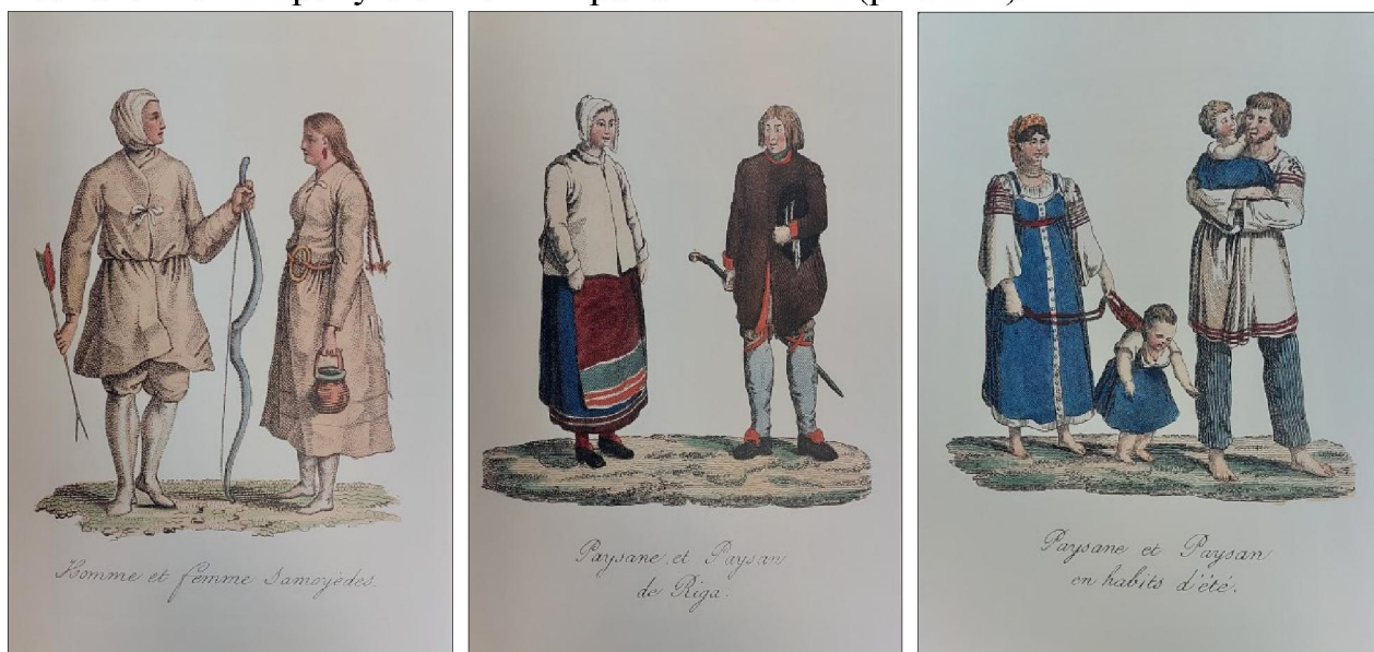
Рис. 6-7. Рисунки из издания Ж.-Б. Бретона с изображением самоеда и самоедки, крестьянина и крестьянки из Риги, крестьянина и крестьянки в летней одежде

В изображении русских костюмов художники Дамам-Демартре и Портер не всегда точно отражали непонятные им детали одежды народов России. Тем не менее, заслуга этих художников в том, что они впервые изобразили простых людей и сцены народной жизни и в какой-то степени познакомили Европу с бытом и нравами России (рис. 6-7).