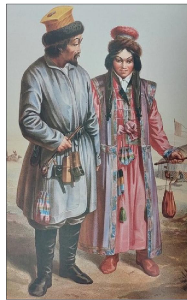
Рис. 8-10. Г.-Т. Паули с изображением грузина и грузинки, эстонцев, калмычки и калмыка

Четырехтомное издание «Народы России» является раритетным по содержанию и художественному исполнению и адресовано в первую очередь искусствоведам, этнографам, художникам. Иллюстрации из представленных в обзоре книг на протяжении нескольких столетий воспроизводятся историческими и этнографическими изданиями.