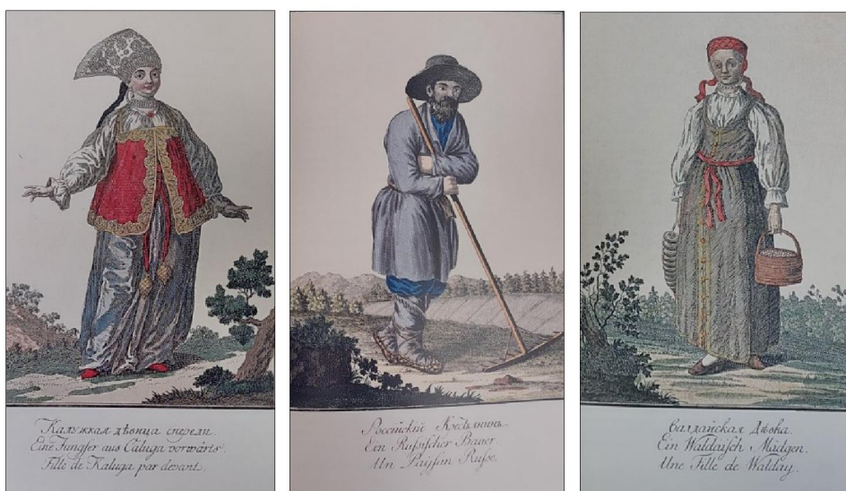
Рис. 1-3. Рисунки из издания И.Г. Георги с изображением калужской девицы, российского крестьянина, валдайской девки

Каждому народу в издании посвящен краткий очерк, который включает сведения о его названии, занимаемых им территориях, истории, религии, обрядах, жилищах. Большую часть практически всех очерков занимают описания мужских и женских костюмов: повседневных, праздничных и обрядовых. Особое значение в издании имеют раскрашенные иллюстрации, выполненные граверами Ротом и Шлеппером. Художники выполняли гравюры по рисункам самого Георги (сделанные им во время путешествий), использовались рисунки и других художников, имена которых можно назвать лишь предположительно (рис. 1-3 49 ).