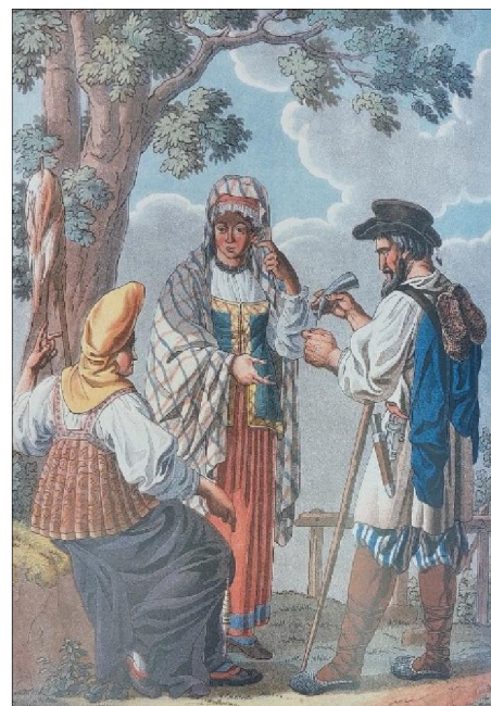
Рис. 5. Иллюстрация «Русские крестьяне» из издания К. Рехберга

Издание является библиографической редкостью, а работами Е. Корнеева в наши дни нередко иллюстрируют публикации по истории и этнографии народов России.