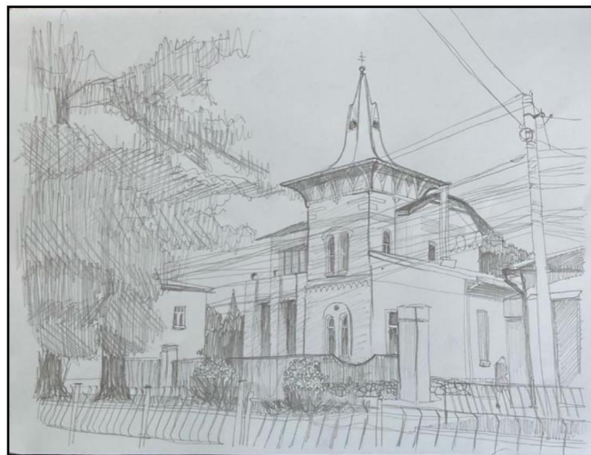
Рис. 2. Д.П. Третьяк. Городской пейзаж. 2022 г. Преподаватель Р.П.Марманов

Рисунок с натуры – не просто фиксация того, что видишь, это процесс создания изображения при помощи визуального наблюдения модели с использованием знаний и представлений, которые были накоплены ранее. Органическое единство теории и практики художественной грамоты в рисунке способствует активному развитию студента, его творческой активности. К научным методам, необходимым для выполнения профессиональных работ, мы относим знание перспективы, анатомии и теорию теней (рис. 2).