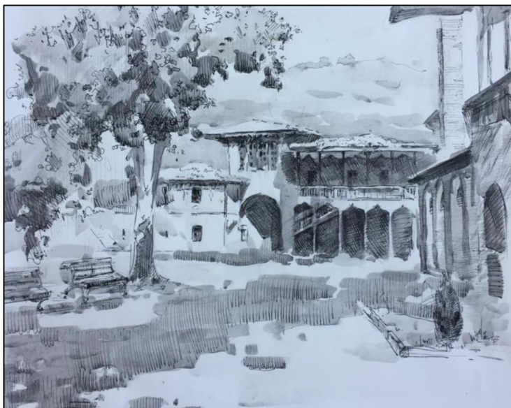
Рис. 4. С.П. Никоноров. Бахчисарай. 2021 г. Преподаватель Р.П. Марманов

5. Выполнение рисунка по памяти на большом формате. Данное задание необходимо выполнять будущим педагогам изобразительного искусства, т.к. их дальнейшая деятельность предполагает выполнение учебных рисунков на доске.