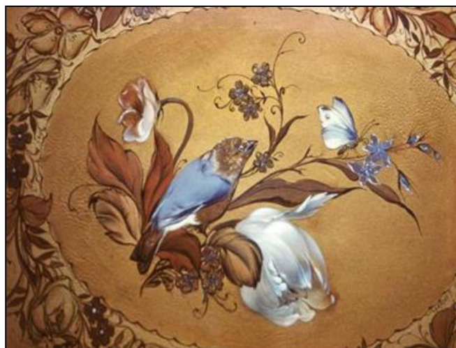
Рис. 17. Г.В. Цветков. Фрагмент росписи. Начало 1990-х гг. Производственное объединение «Художественная гравюра» 21

Изучая художественно-стилистические особенности, сохранившихся изделий массового производства ПО «Художественная гравюра» с ручной росписью, можно заметить в них черты жостовской и нижнетагильской декоративных росписей, палехской лаковой миниатюрной живописи и городецкой росписи. Художники производственного объединения решали трудные творческие и художественные задачи, находясь в поиске нового. Информация о деятельности производственного объединения «Художественная гравюра», о художниках, работающих в то время, важна для осмысления сущности и истории развития стиля декоративной росписи, именуемого «московское письмо».