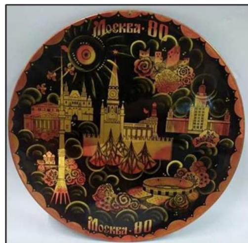
Рис. 8. Поднос-панно «Олимпиада». 1980 г. Производственное объединение «Художественная гравюра»

Четвёртая тематика – Олимпиада 1980 г. «Художественная гравюра» получила большой заказ для разработки и выпуска сувенирной продукции, посвящённой Олимпиаде. Нам удалось исследовать два изделия: поднос-панно круглой формы, расписанный по подкладкам из металлизированного порошка. Композиция подноса состоит из плоскостно изображённых архитектурных памятников города Москвы, текста «Олимпиада 80» и украшена по краю орнаментом в виде полукругов (рис. 8) 12 .