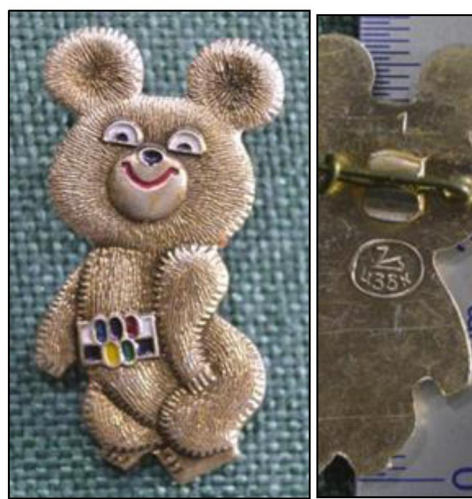
Рис. 10. Значок «Олимпийский мишка». 1980 г. ПО «Художественная гравюра» 14