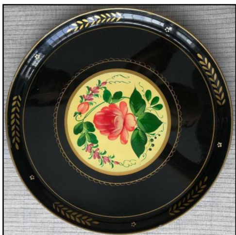
Рис. 4. Копия подноса «Роза». Художник И.А. Королева. Производственное объединение «Художественная гравюра»

– худ. Голубев, «Страдание» – худ. Горчаков; «Кадриль» – худ. Горчаков, шкатулки «Подсолнухи», «Танец», «Добро пожаловать»; подносы «Хор», «Под яблоней» (рис. 7) [4].