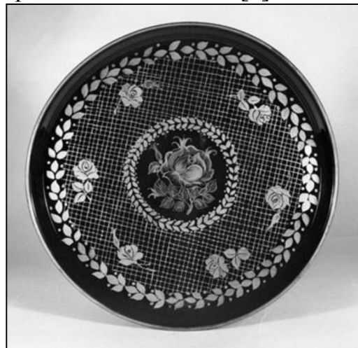
Рис. 12. Поднос «Цветы на сетчатом фоне». Производственное объединение «Художественная гравюра», г. Москва. 1983 г. 16