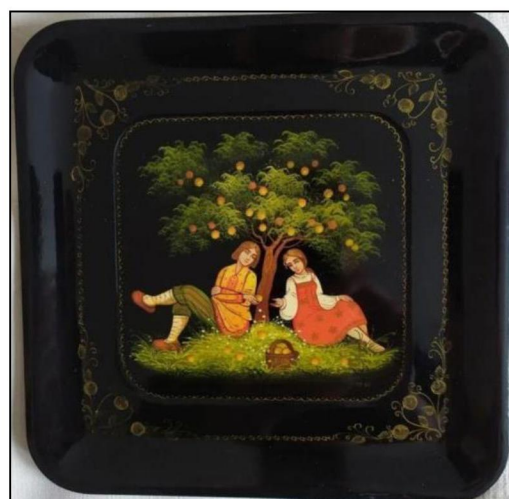
Рис. 7. Поднос «Под яблоней». Производственное объединение «Художественная гравюра» 11

Третье направление – Московская тематика. Изделий или фотографий изделий с росписью на эту тему практически не сохранилось. В буклете производственного объединения названы: «панно "Парк культуры" и "Арбат"», возникшие на основе рекомендаций Научно-исследовательского института художественной промышленности, которые, благодаря своему радостному колориту, перекликаются с темой народного праздника.