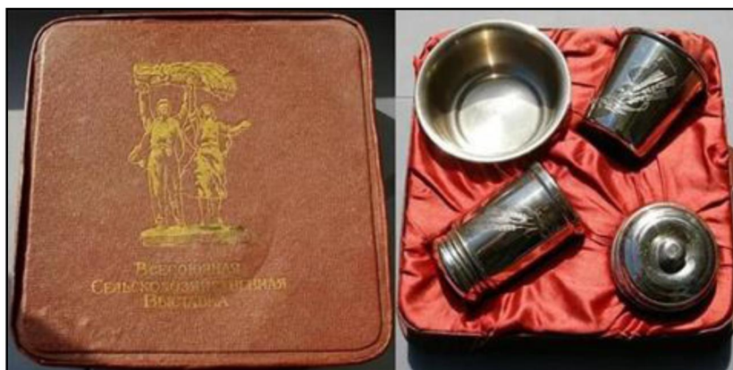
Рис. 1. Набор для бритья «ВСХВ». Изготовлено для Всероссийской сельскохозяйственной выставки. 1970-е гг. Производственное объединение «Художественная гравюра»

Формирование декоративной росписи в стиле московского письма связано с деятельностью производственного объединения «Художественная гравюра», включающего заводы «Металлодеталь», «Художественная гравюра на металле» и экспериментальный творческо-производственный комбинат Всероссийского общества охраны памятников истории и культуры «Русский сувенир».