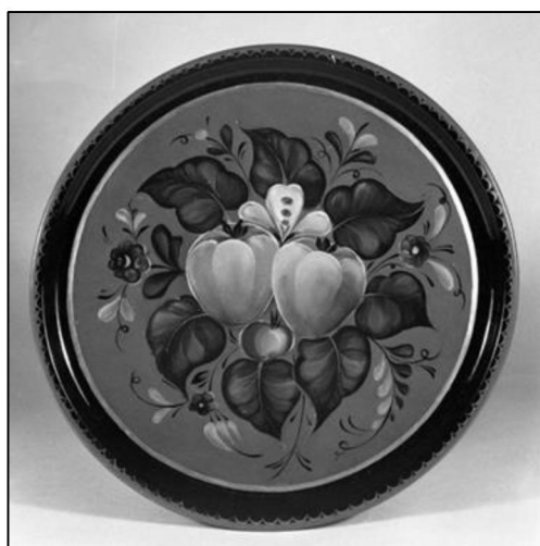
Рис. 13. И.А. Королева. Поднос «Яблоки». Производственное объединение «Художественная гравюра» г. Москва. 1982 г. 17