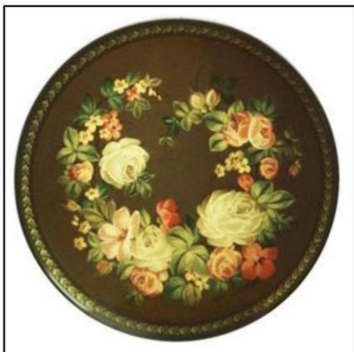
Рис. 16. И.В. Суворова. Поднос с росписью. Начало 1990-х г. Производственное объединение «Художественная гравюра» 20