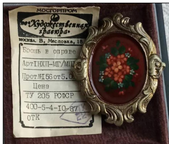
Рис. 5. Брошь в оправе. Производственное объединение «Художественная гравюра» 9