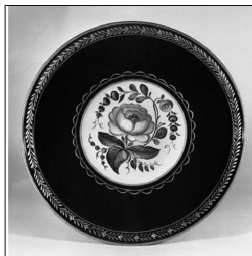
Рис. 14. И.А. Королева. Поднос «Роза». Производственное объединение «Художественная гравюра», г. Москва, 1982 г. «Фототека НИИХП» 18