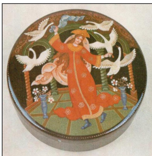
Рис. 6. Шкатулка «Сказочные мотивы». Производственное объединение «Художественная гравюра» 10