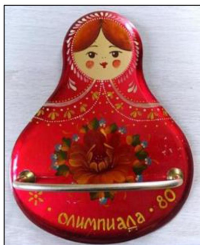
Рис. 9. Вешалка для полотенец «Матрёшка 80». 1980 г. ПО «Художественная гравюра» 13

Второе изделие – вешалка «Матрёшка 80» (автор Г.К. Высоцкая), выполненная в форме силуэта матрёшки, имеет расписанное личико и украшена орнаментами и цветочной композицией (рис. 9). Также интересно, что на производственном объединении изготавливалась часть легендарных значков в виде олимпийского мишки (рис. 10).