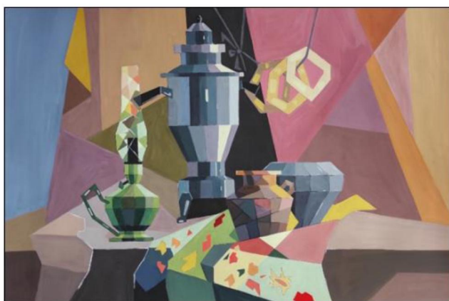
Рис. 3. Декоративная переработка натюрморта, имитация интарсии