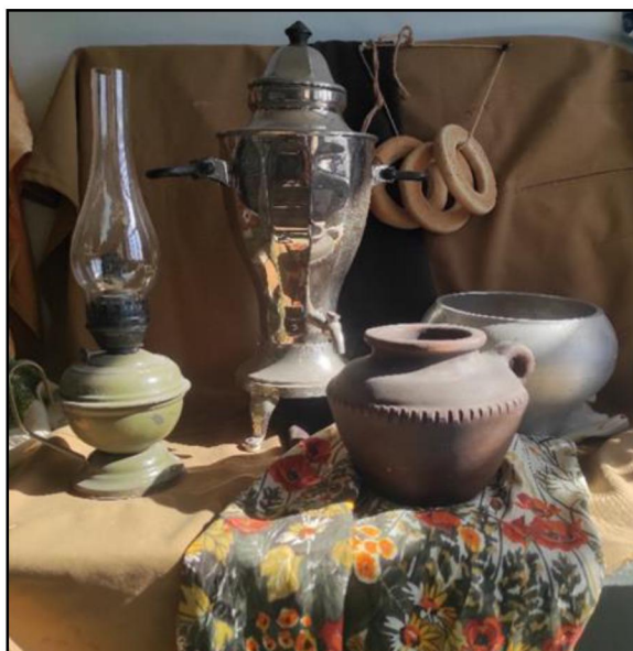
Рис. 1. Аудиторная постановка натюрморта по декоративной живописи для студентов направления «Художественная обработка кожи и меха»

Аудиторное обучение студентов декоративному подходу в изобразительной деятельности специальности «Художественная обработка изделий из кожи и меха» выстроено следующим образом: декоративные задания начинаются с первого курса, постепенно усложняясь [6]. Опираясь на разработки И.А. Безиной, [3, с. 54] в рамках программного задания по декоративной живописи студентам предлагается выполнить декоративную переработку