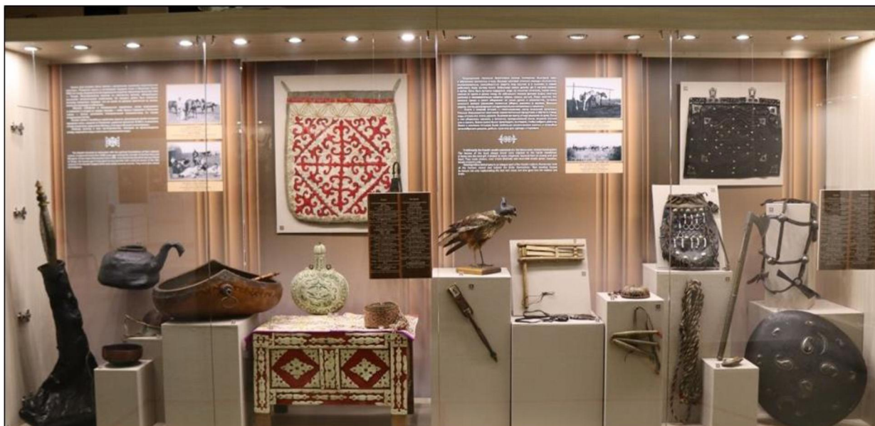
Рис. 5. Фрагмент постоянной экспозиции Омского историко-краеведческого музея «Этническая панорама Сибири»

В постоянную экспозицию «Этническая панорама Сибири» Омского историко-краеведческого музея входят экспонаты кожаных изделий, найденных на территории Омской области (рис. 5).