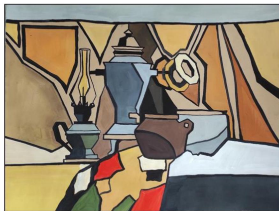
Рис. 4. Декоративная переработка натюрморта, имитация пирографии

Таким образом, студенты закрепляют знания, полученные на занятиях по исполнительскому мастерству, и учатся создавать эскизы для изделий из кожи, учитывая техники обработки материала.