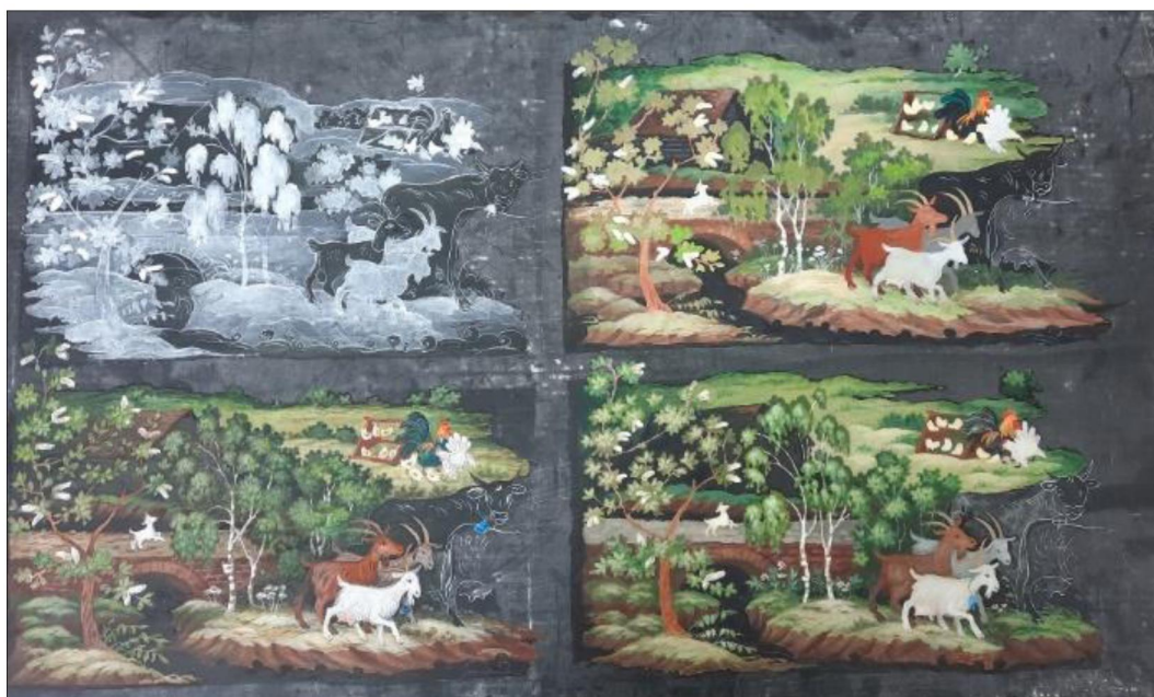
Рис. 2. Технологическая последовательность поэтапного выполнения росписи фрагмента композиции «Далекое детство»

Глубокие знания традиций и технологии холуйской миниатюры помогли Л.Л. Никонову найти инновационный подход использования