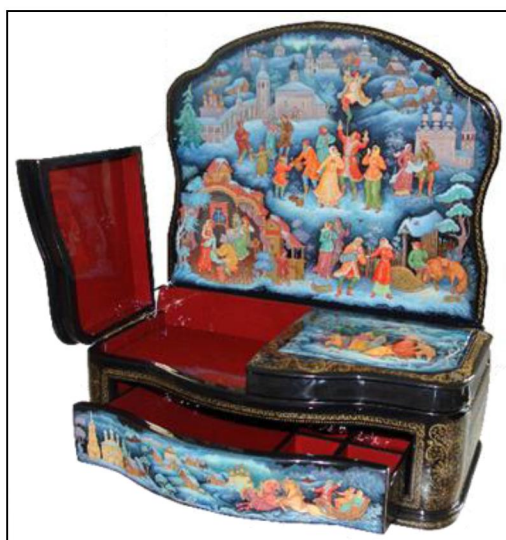
Рис. 4. В. Поликарпова. Шкатулка для женских украшений «Праздник Русской зимы». 2013 г. Руководитель: Ю.А. Бесшапошникова