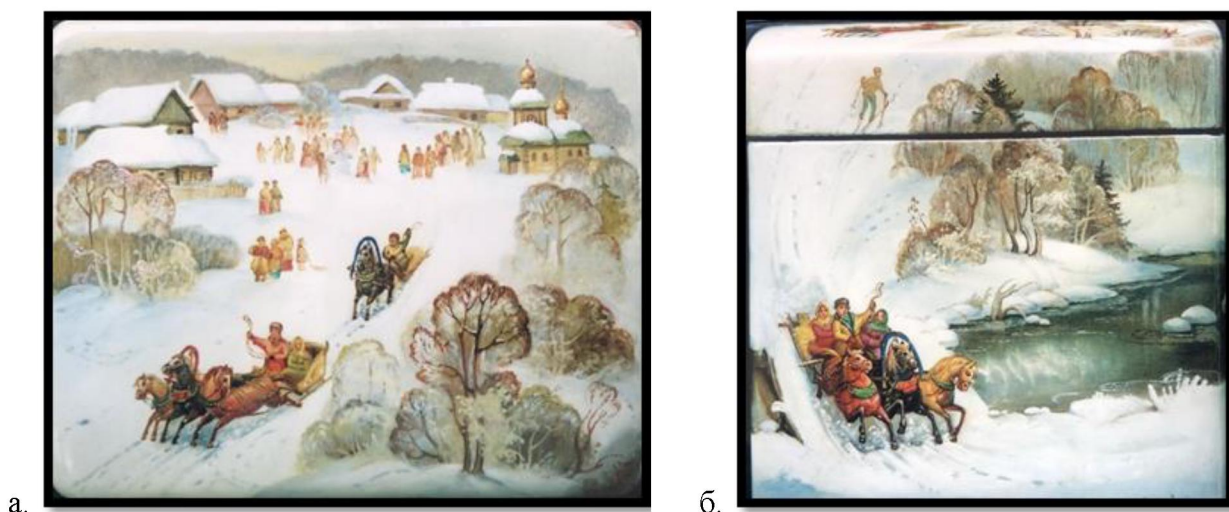
Рис. 4. Н.А. Зотов. Шкатулка «Праздник Федоскино»: а) крышка шкатулки; б) торец шкатулки. 2017 г.

изделии «Лыжники» (2018 г.) мастер демонстрирует связь человека с природой.