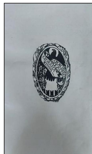
Рис. 3. Логотип серии «Русские художники», выполненный Е. Лансере

Игорь Грабарь так описывает историю возникновения замысла о создании монографии. Произошло это в 1906 г. в Париже во время выставки