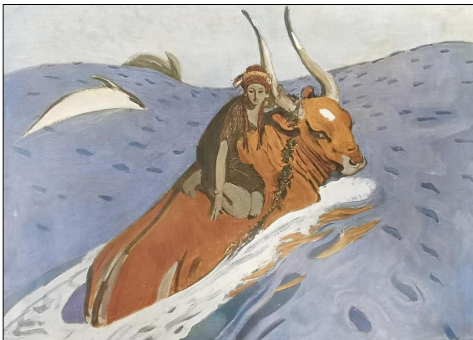
Рис. 6. «Похищение Европы». 1910 г.

В заключительной главе монографии «Черты жизни и творчества» Игорь Грабарь пишет, что искусство всегда тесно сплетено с личностью и чем оно значительней и подлинней, тем теснее этот союз, тем больше художественный облик сливается с человеческим. Но редко у кого искусство так определенно вытекало из самой сущности человека, как мы видим из творчества В.А. Серова. Две основные черты характера, которыми он резко отличался от всех окружающих, объясняют все его искусство: правдивость и любовь к простоте.