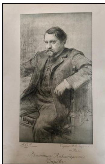
Рис. 2. Фронтиспис – автотипия портрета В.А. Серова написанного И.Е. Репиным