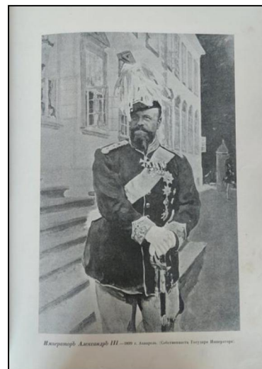
Рис. 5. Портрет Александра III. 1899 г.