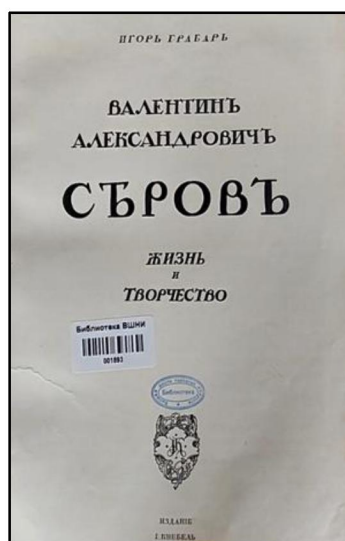
Рис. 1. Титульный лист издания И. Грабаря «Валентин Александрович Серов. Жизнь и творчество»

В фонде научной библиотеки ВШНИ (академии) хранится уникальное издание о художнике – Валентине Серове, занесенное в реестр «Книжных памятников» России. Автором издания был историк искусства, музейный деятель, художник – Игорь Грабарь (1871-1960). Издание вышло в серии «Русские художники» и было выпущено небывалым для того времени тиражом – 18 тысяч экземпляров (рис. 1-3) 54 [1].