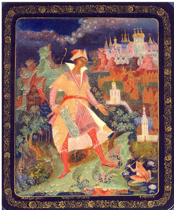
Рис. 2. В.Ф. Некосов. Шкатулка «Царевна-лягушка». 2010 г. Коллекция автора работы