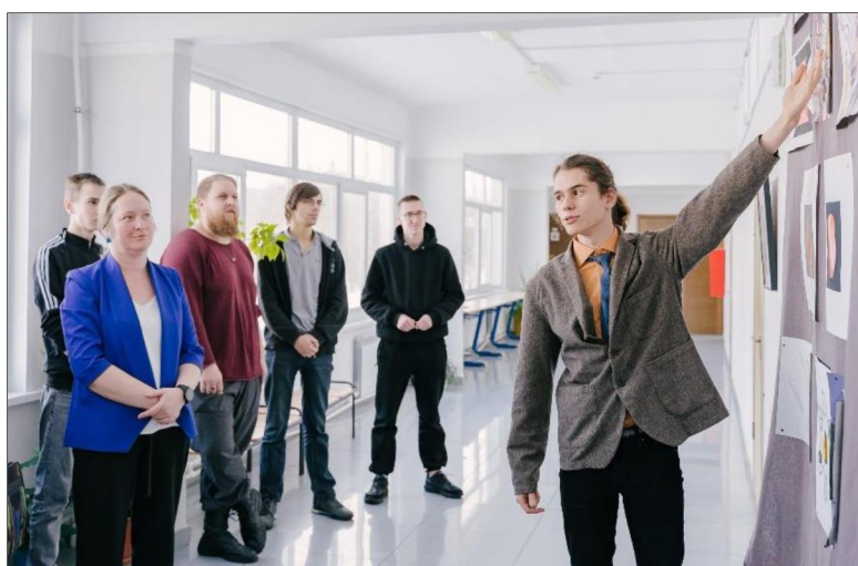
Рис. 15. Участники и гости фестиваля «Традиционные художественные промыслы в эпоху инноваций»

фестиваля «Традиционные художественные промыслы в эпоху инноваций», что особенно актуально и значимо в аспекте сохранения и развития