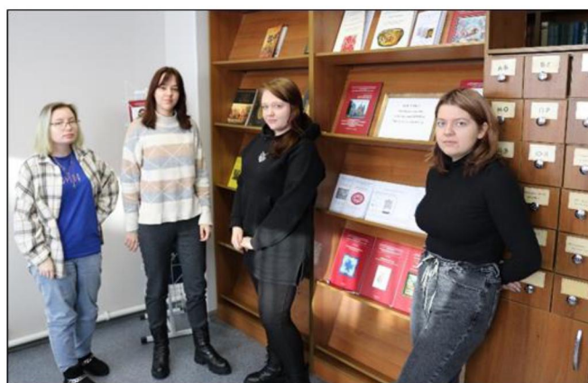
Рис. 20. Посетители выставки научных учебных и методических изданий Высшей школы народных искусств (академии) за 2022-2023 год в библиотеке Мстёрского института лаковой миниатюрной живописи им. Ф.А. Модорова

Дополнили День российской науки в Мстёрском институте лаковой миниатюрной живописи им. Ф.А. Модорова аналитический обзор научных учебных и методических изданий Высшей школы народных искусств (академии) за 2022-2023 год (рис. 20) и онлайн-показ