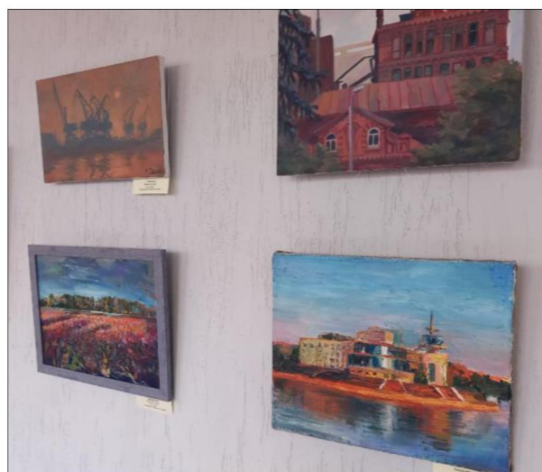
Рис. 24. Фрагмент экспозиции выставки «Красота родного края»

Научные мероприятия института сопровождались выставкой «Красота родного края», на которой представлены творческие работы обучающихся по специальности «Живопись», выполненные в каникулярное время (рис. 24).