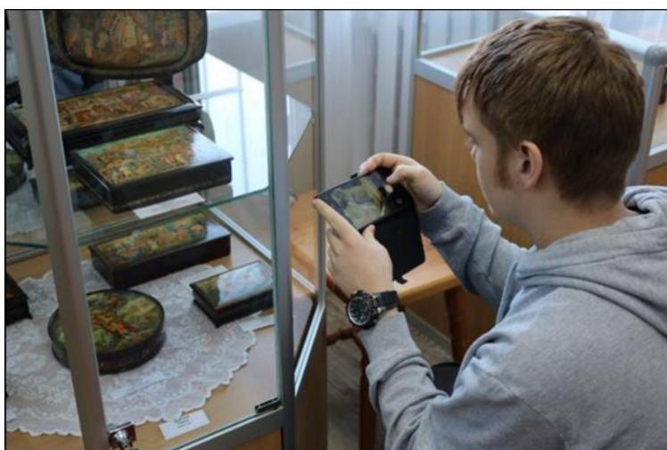
Рис. 19. Фрагмент экспозиции выставки работ из фонда научно-художественного музея Мстёрского института лаковой миниатюрной живописи им. Ф.А. Модорова

творческого почерка будущих художников, последовательность организации художественно-творческой деятельности выпускников прошлых лет