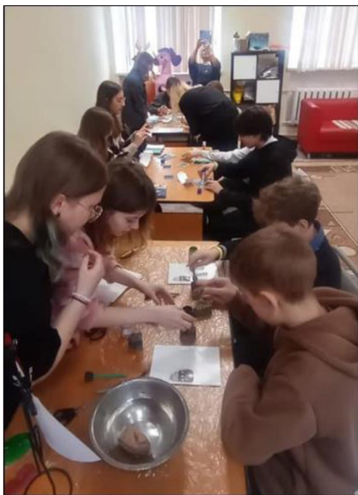
Рис. 23. Культурно-образовательный интенсив «Профессиональная проба»