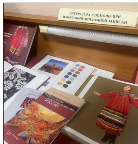
Рис. 14. Литература, необходимая для подготовки выпускной квалификационной работы

Студенты обратили внимание на разнообразные подходы к оформлению приложения к выпускной квалификационной работе, обусловленные особенностями творческого самовыражения при его составлении: принципы закрепления фрагментов ткани и образцов, особенности подбора фона, варианты составления коллажа из иллюстраций, послуживших источником вдохновения при разработке дипломного проекта.