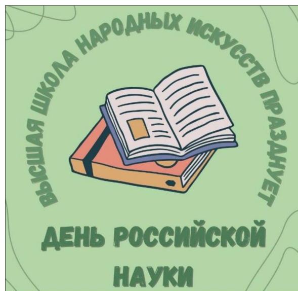
Рис. 1. Эмблема Дня российской науки в Высшей школе народных искусств (академии)

Высшая школа народных искусств (академия) – уникальный вуз, сохраняющий и развивающий традиционные художественные промыслы не только в аспекте художественно-творческой работы, но и фундаментальных и прикладных