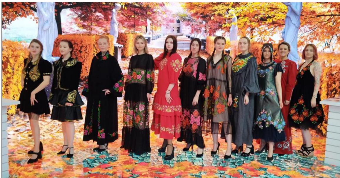
Рис. 9. Студенты Института традиционного прикладного искусства в женских костюмах, декорированных художественной вышивкой