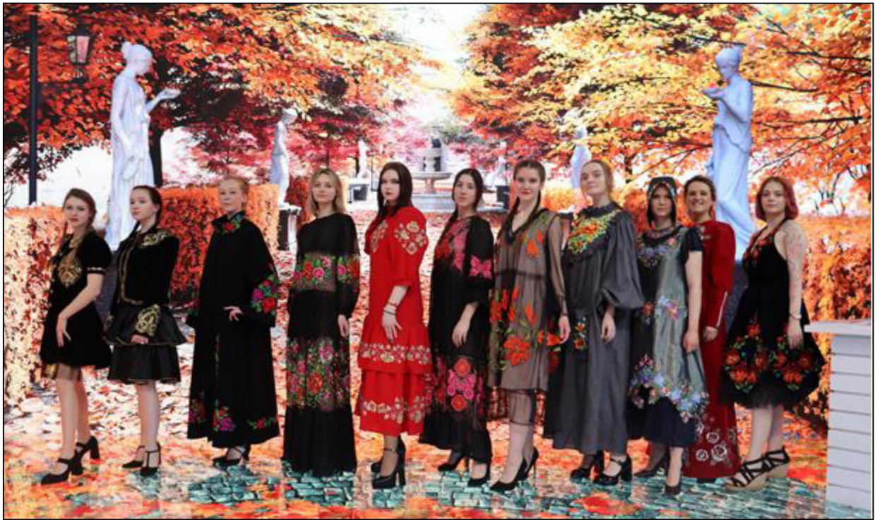
Рис. 4. Платья с художественной вышивкой