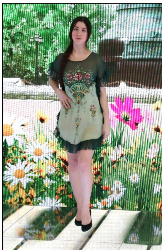
Рис. 3. Платье с художественной вышивкой