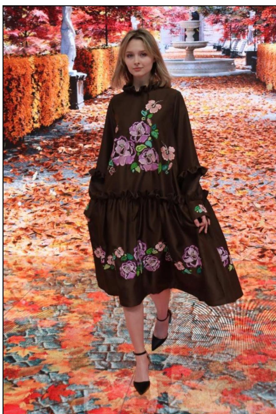
Рис. 2. Платье с художественной вышивкой