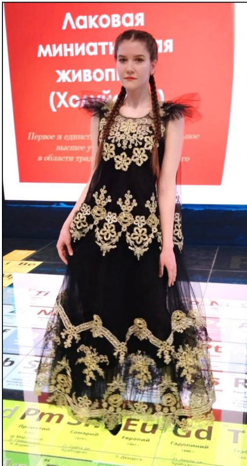
Рис. 7. Платье. Художественное кружевоплетение