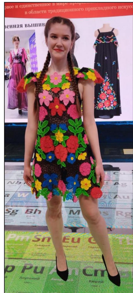
Рис. 6. Платье. Художественное кружевоплетение