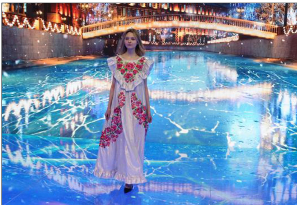
Рис. 1. Платье с художественной вышивкой