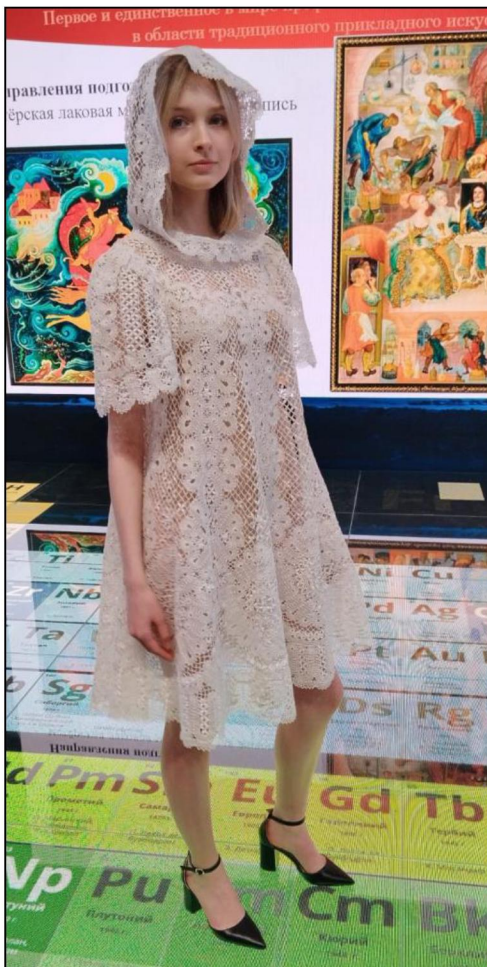
Рис. 5. Платье. Художественное кружевоплетение