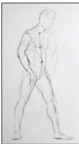
Рис. 4. Набросок натурщика в статичной позе

С целью реализации поставленных задач в Федоскинском институте лаковой миниатюрной живописи разработана новая программа по академическому рисунку, в которой первостепенное внимание уделено всестороннему освоению особенностей изображения человека на основе знаний пластической анатомии. В программе представлен ряд заданий по изображению человека с натуры: кратковременные наброски для изучения пропорций, пластики и движения фигуры; зарисовки фигуры в статическом положении и движении; длительные задания по рисованию натурщиков на разных форматах – от А2 до А5.