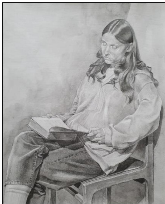
Рис. 6. Учебная работа «Сидящая фигура натурщицы»

В четвертом семестре продолжается изучение человека. Темы «Сидящая фигура натурщицы» (рис. 6), «Рисование «Сидящая фигура натурщицы с музыкальным инструментом». Студенты также рисуют экорше и гипсовую фигуру лошади.