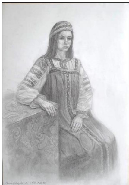
Рис. 9. Учебная работа «Натурщик в историческом костюме»