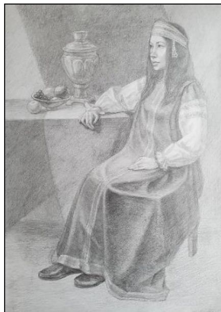
Рис. 10. Учебная работа «Чаепитие в интерьере»

Помимо углублённого изучения человека с натуры на аудиторных занятиях студенты Федоскинского института копируют рисунки великих художников, выполняют домашние работы: наброски и зарисовки с натуры.