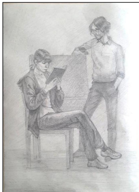
Рис. 7, 8. Зарисовки двухфигурной постановки