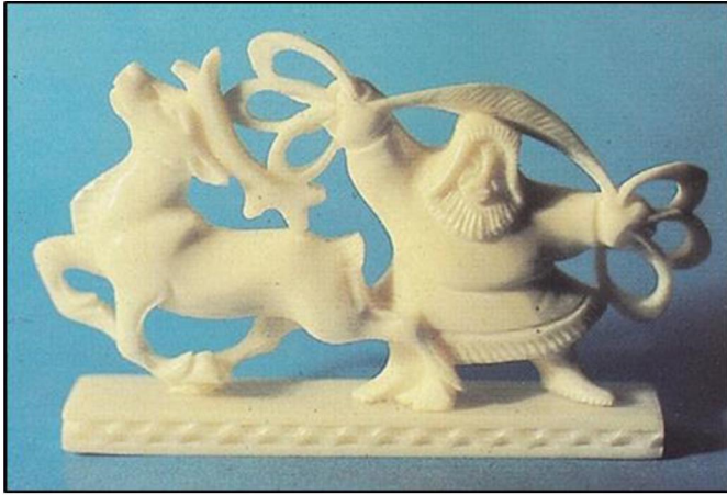
Рис. 4. Н.Д. Буторин. Скульптурная композиция. «Ловля оленя». 1968 г. Художественная обработка кости