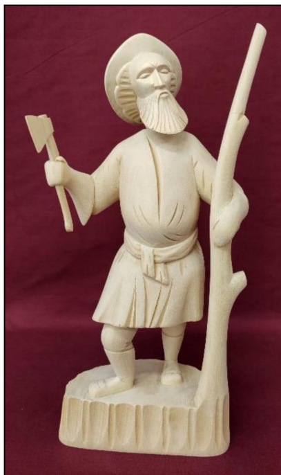
Рис. 3. Е.С. Птицын. Скульптура «Дровосек». 2023 г. Богородская художественная резьба по дереву

определяют необходимость подробного изучения внешней формы фигуры и ее анатомического обоснования. Объемное изображение фигуры человека в богородской скульптуре, традиционной резьбе по кости требует более детального рассмотрения анатомии. Для художников этих направлений, кроме грамотно переданной формы фигуры, также необходима передача характера, эмоций и настроения персонажей через мимику, позы и пластику фигуры.