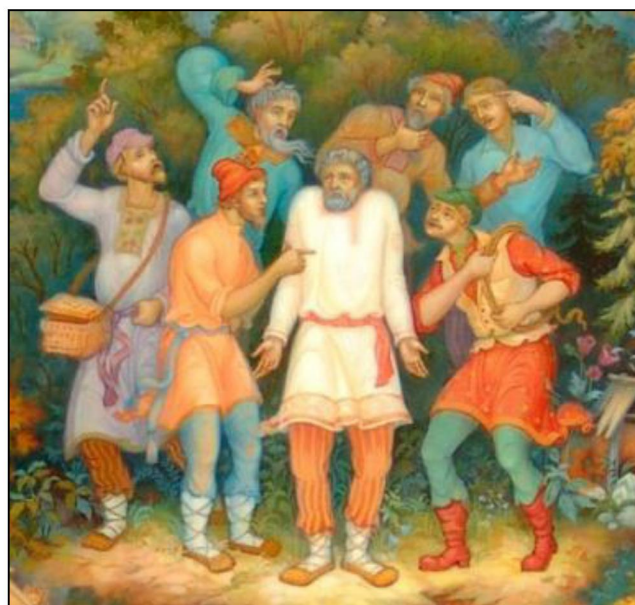
Рис. 7. М. Ершова. Панно «Кому живет весело, вольготно на Руси», фрагмент. Холуйская лаковая миниатюрная живопись. Выпускная квалификационная работа. 2012 г. Руководитель Ю.А. Бесшапошникова

Кроме того, особенностью лаковой миниатюрной живописи является изображение фигур в движении, что является сложной задачей для