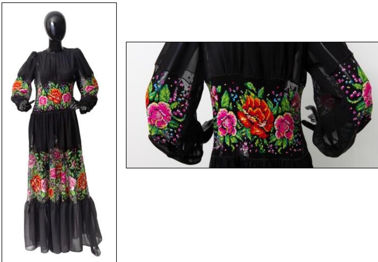
Рис. 1, 2. С. Братчикова «Ночные цветы». Выпускная квалификационная работа «Создание современного орнаментального решения женской одежды с применением традиционных приемов». 2019 г. Руководитель С.Ю. Камнева

вышивки «ивановская строчка». (рис. 1, 2 36 ) Автору удалось, сохранив традиционные технологии выполнения вышивки в сочетании с органично подобранным колористическим решением и проработкой кроя, создать изделие, раскрывающее тему. В изделии воплощен образ вечернего платья, соответствующий требованиям современной моды. Данное изделие с 2019 г. неоднократно экспонировалась на различных выставках, проводимых Институтом традиционного прикладного искусства.