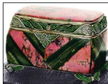
Рис. 4. В.С. Безбородов. Шкатулка «Классическая». 1993 г. Нижнетагильский музей изобразительных искусств

В.С. Безбородов использует мельхиор и никель в технике филигрании иковки. По его мнению, эти техники органично сочетаются с природным камнем. Включение гнутого и кованного металла в ювелирные изделия является не просто обрамлением камня, а следование художественному стилю в традициях камнерезного искусства. Пластично выраженный металл, природная фактура и резьба по камню являются средствами для создания художественного образа (рис. 5-7 58 ).