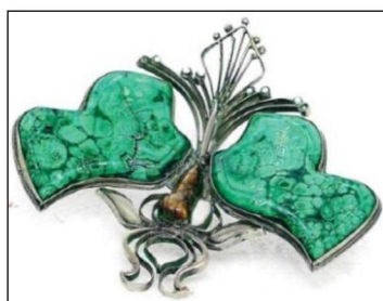
Рис. 6. В.С. Безбородов. Брошь «Бабочка». 1999 г. Нижнетагильский музей изобразительных искусств