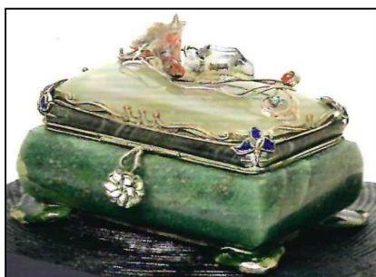
Рис. 2. В.С. Безбородов. Шкатулка «Изящная». 2017 г. Нижнетагильский музей изобразительных искусств