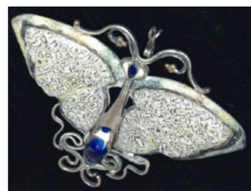
Рис. 7. В.С. Безбородов. Брошь «Ситцевая бабочка». 2016 г. Нижнетагильский музей изобразительных искусств

В своих изделиях В.С. Безбородов использует различные камни и сочетает их (рис. 8-10 59 ). Например, в кольцо «Осень» художник представил в форме влажных осенних листьев: агат, кварцит яшму и дымчатый хрусталь [2] (рис. 9).