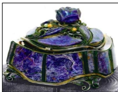
Рис. 3. В.С. Безбородов. Шкатулка «Каменные цветы». 1986 г. Нижнетагильский музей изобразительных искусств