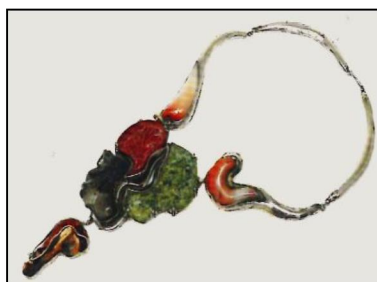
Рис. 9. В.С. Безбородов. Колье «Осень». 2006 г. Нижнетагильский музей изобразительных искусств