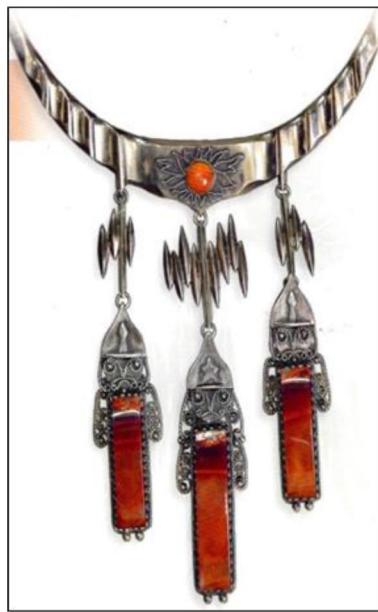
Рис. 13, 14. Ю.П. Маточкин. Гарнитур «Русь». 1985 г. Нижнетагильский музей изобразительных искусств