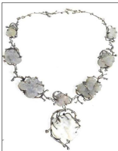
Рис. 15. С.Ю. Маточкин. Колье «Зимняя сказка». 2001 г.

подчеркивая красоту камней, каждый из которых отличается индивидуальным рисунком (рис. 16, 17).