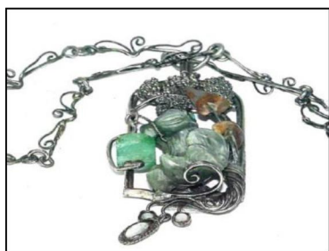
Рис. 8. В.С. Безбородов. Колье «Светлячок». 1991 г. Нижнетагильский музей изобразительных искусств