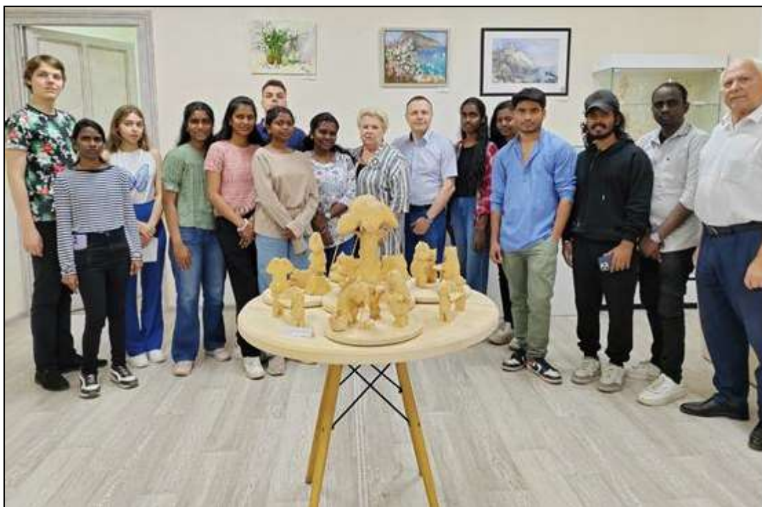
Рис. 3. Студенты I курса Медицинской академии им. С.И. Георгиевского