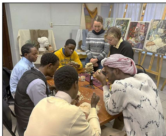
Рис. 5. Мастер-класс по богородской художественной резьбе по дереву

IV Международный форум «Традиционные художественные промыслы и высшее профильное образование: современные вызовы и перспективы» стал платформой для обсуждения вопросов сохранения и развития традиционных художественных промыслов, а также направлений совершенствования системы высшего профильного образования в этой области.