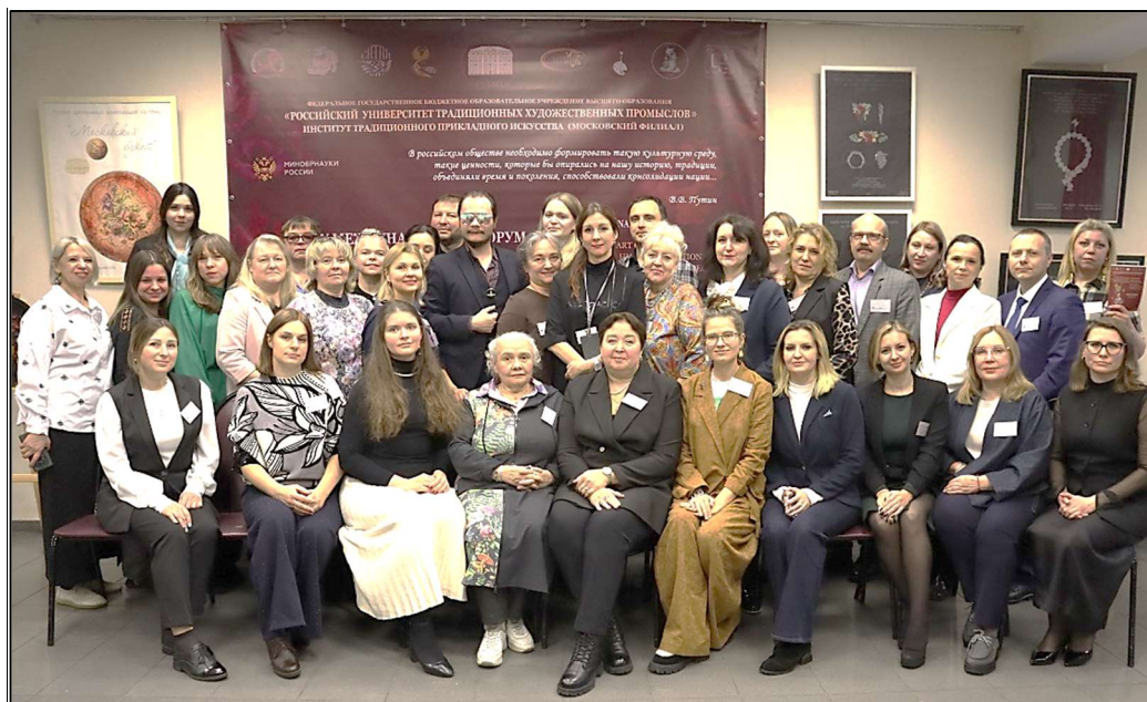
Рис. 6. Участники IV Международного форума «Традиционные художественные промыслы и высшее профильное образование: современные вызовы и перспективы»

и зарубежными учебными заведениями в сфере традиционного прикладного искусства обладает значительным потенциалом для дальнейшего развития.