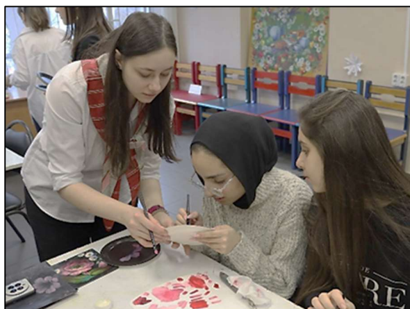
Рис. 4. Мастер-класс по жостовской декоративной росписи в технике

Второй день Форума представлял собой художественно-творческий марафон по видам традиционных художественных промыслов, в ходе которого участники познакомились с базовыми приёмами жостовской росписи (рис. 4), богородской художественной резьбы по дереву (рис. 5), холуйской лаковой миниатюрной живописи, художественной вышивки в техниках «олонецкое шитье» и «белая гладь».