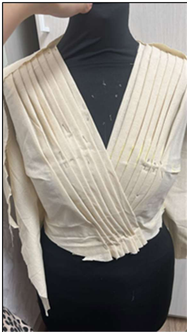
Рис. 1. Макет-наколка блузы сложного кроя на манекене

элементов и осваивать методы их органичного включения в изделие. Моделирование может осуществляться как на плоскости через поисковые и технические эскизы, так и в объемной форме – посредством муляжного метода, при котором макет изделия конструируется и декорируется с учетом пластики ткани, направления рисунка, светотеневого восприятия и фактурных характеристик используемых материалов (рис. 1 31 ).