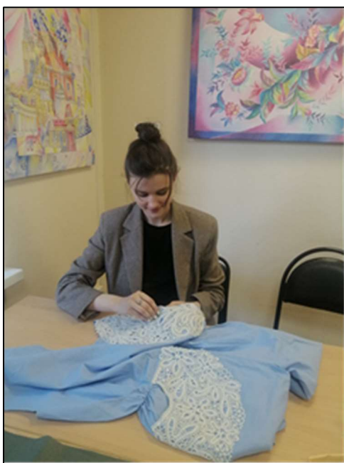
Рис. 2. Сборка макета изделия с декоративной вставкой кружева

Следующим этапом становится практическое моделирование, где, опираясь на знания о типологии силуэтов, студент разрабатывает серию эскизов одного и того же изделия в разных вариантах конструктивной формы, подбирая к каждому из них определенный вид декора. Так, при работе в технике вышивки «кадомский вениз», отличающейся мягкими, округлыми мотивами и плавным переходом между элементами узора, студенты ищут решения с использованием овальных или трапециевидных силуэтов, расширяющихся книзу, где декоративное оформление плавно перетекает по поверхности ткани, создавая гармонию между пластикой формы и орнамента. При этом особое внимание уделяется масштабированию рисунка – крупные элементы вениза требуют просторных участков ткани без лишних членений, тогда как мелкий орнамент может быть интегрирован в сложные членения кроя (рис. 2-4).