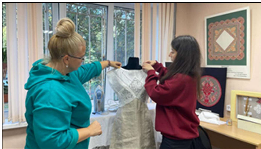
Рис. 4. Практическое занятие: поиск размещения декоративного элемента на макете изделия

совпадающие с конструктивными линиями кроя, тогда как асимметричные или диагональные решения лучше сочетаются с более свободными и органичными видами вышивки.