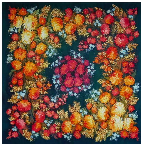
Рис. 7, 8. А. Заболотских. Шали из коллекции «Теплые чувства». 2024 г.