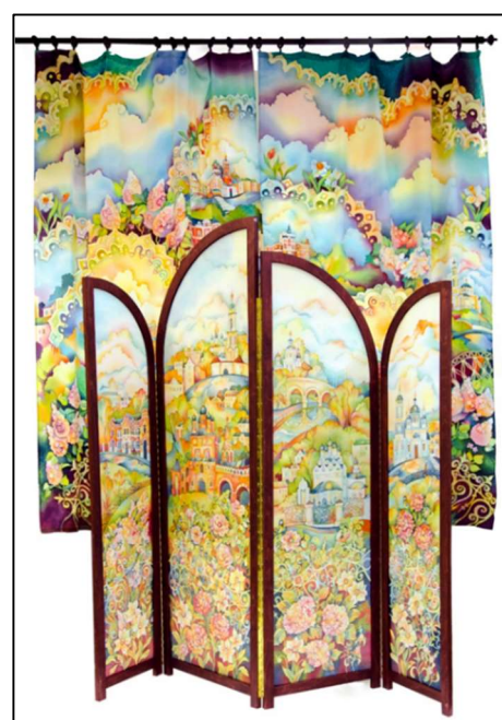
Рис. 2. Е. Чигарина. Ширма и занавески «Московский полдень». 2015 г. Руководитель: Ю.С. Салтанова

3. Художественно-стилистическая интеграция заключается в объединении стилистических приемов, цветовых решений и композиционных особенностей разных видов традиционных художественных промыслов.