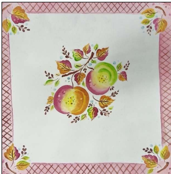
Рис. 9. О.П. Кунаховец. Художественно-графический проект росписи сувенирного платка. 2025 г.

5. Концептуальная интеграция – создание объектов, в которых художественная роспись ткани и другие виды традиционного прикладного искусства играют равноправную роль при создании масштабных объектов. К данному виду интеграции видов традиционных художественных промыслов относится разработка серий изделий, объединенных общей темой, стилем и техникой исполнения, независимо от материала. В этом случае интеграция применяется для передачи определенных идей и смыслов, отражающих современные социальные, экологические и культурные проблемы.