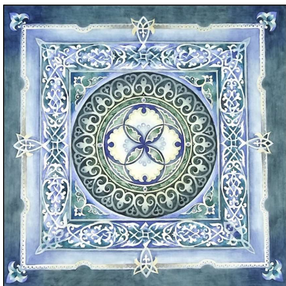
Рис. 6. О. Ухналева. Учебная работа.